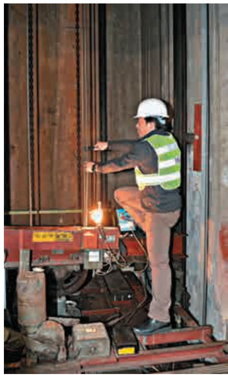
▲維修業既不能北移，也難以被取代，因此只要從業員學得一技之長，踏實工作，應可確保有穩定收入

香港現時約有73萬輛領牌車輛，較2012年增加13%，車房聘用人員接近13,000。隨着車輛不斷增加，維修人員需求也在上升。與此同時，全港有超過72,000部電梯，每年平均增加逾千部，按每101名市民擁有一部電梯計算，香港升降機密度居全球第一，電梯從業員為6,600人。至於已是都市消