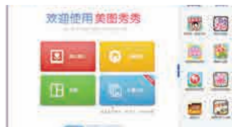
▲「美圖秀秀」的簡體字網頁

市場消息指，大型發電機組系統集成商偉能集團(01608)將以每股2.78元定價，是招股價2.78元至3.47元的下限。