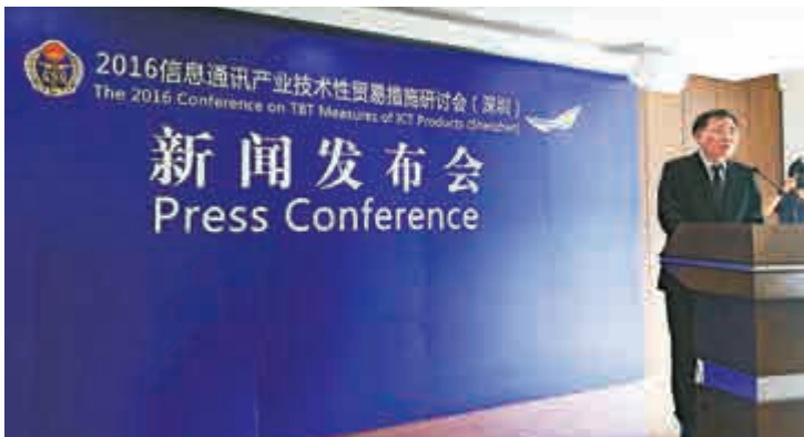
◀2016信息通訊產業技術性貿易措施研討會發布會