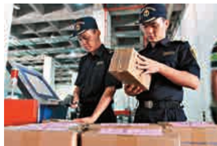
▲海關對進出口貨物掃描

圳通訊企業30億美金的損失，影響企業出口，增加企業運營成本和時間，對產業鏈也會有所衝擊。僅檢測經費就在300到400萬元人民幣，產品研發要多了2到3個月周期。此次研討會對深圳市深入理解主要貿易國家技術性貿易措施，促進深圳信息通訊產業和向外型經濟發展有重要作用。