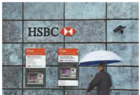
▲傳媒引述消息報道，滙豐銀行涉有客戶與敘利亞的恐怖分子有連繫