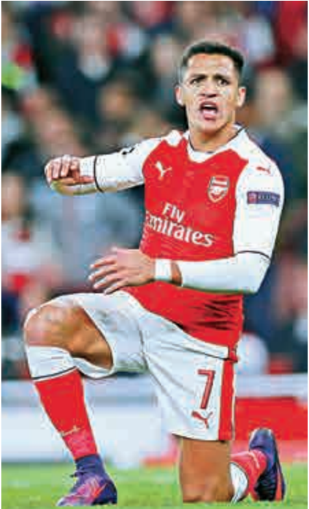
▲阿仙奴鋒將阿歷斯山齊士