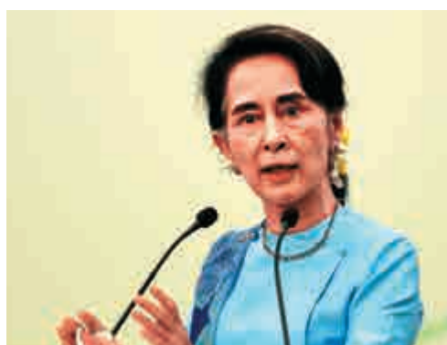
▲昂山素姬10月在内比都出席會議 美聯社

【大公報訊】綜合英國廣播公司網站及中新社報道：緬甸邊境許多少數民族聚居地區戰亂持續多年，緬甸國務資政昂山素姬努力爭取