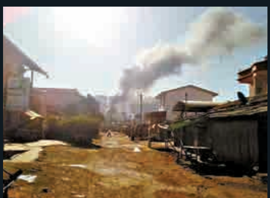
▲緬北衝突有炮火爆炸冒黑煙