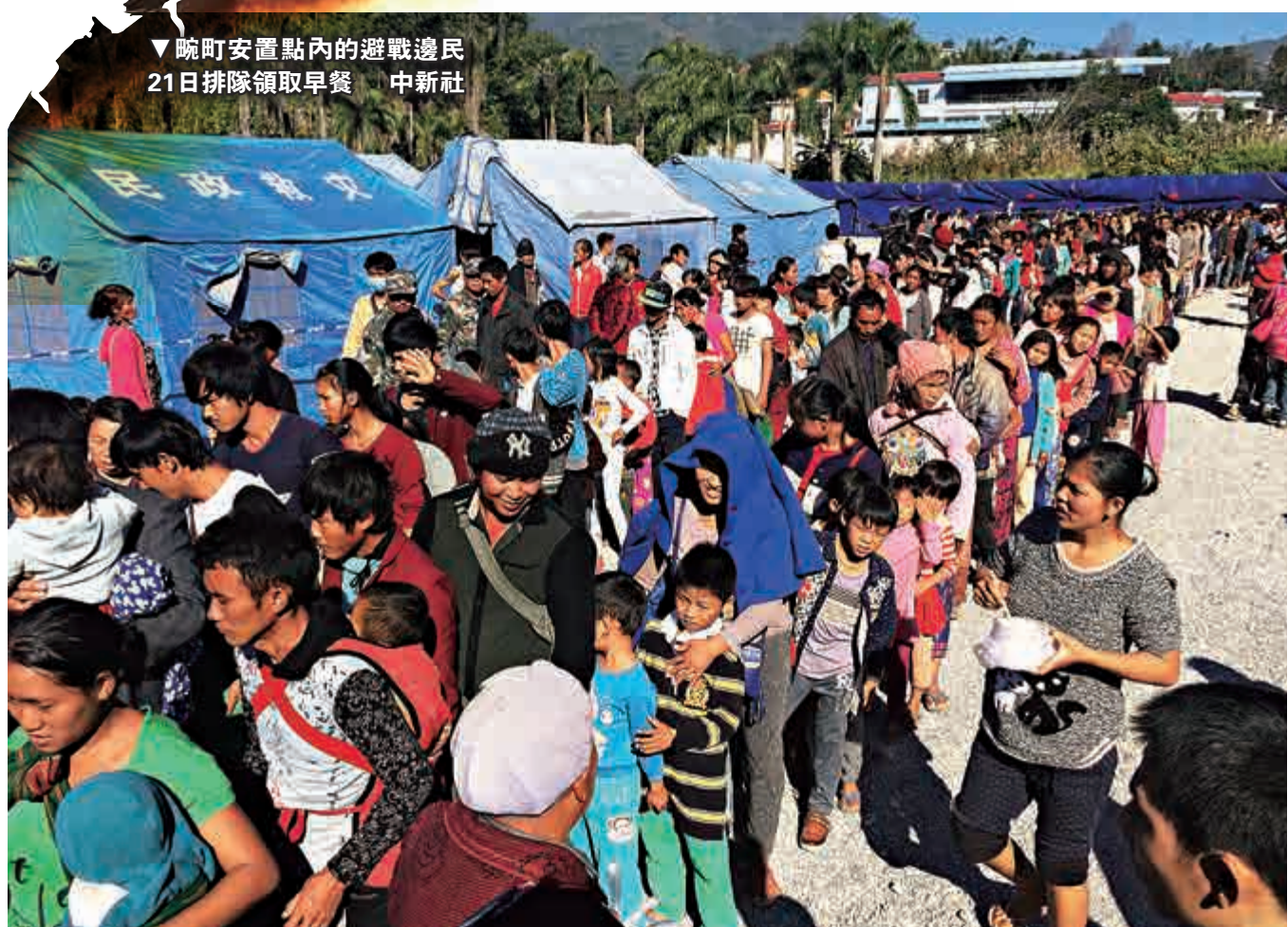
▲晚町安置點內的避戰邊民 21日排隊領取早餐

這是緬北多支民族武裝自去年2月果敢戰事以來首次大規模聯合行動，構成緬北局勢新的嚴重態勢。中國駐緬甸大使館當天發表聲明，呼籲衝突各方保持克制，採取切實有效措施盡快恢復中緬邊境地區安寧。