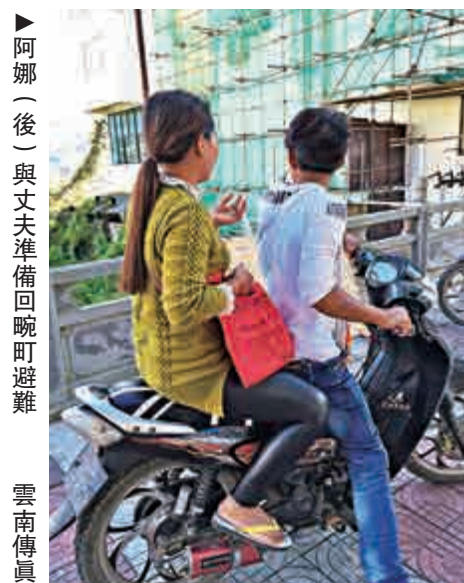
▲阿娜(後)與丈夫準備回晚町避難

【大公報訊】記者丁樹勇昆明報道：11月20日下午時分，在中緬邊境晚町碼頭，前來旅遊的師小姐一行遇到一對年輕男女，共騎一輛摩托匆匆由緬甸一側往中方駛來，分明已到他們認爲的安全地帶，仍驚魂未定。