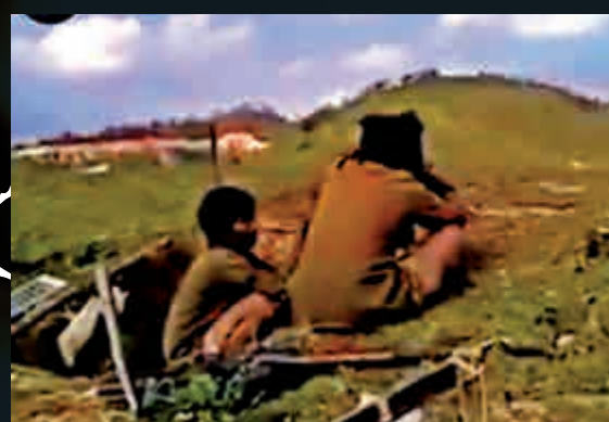
▲緬北民族武裝20日與政府軍交火 網上圖片