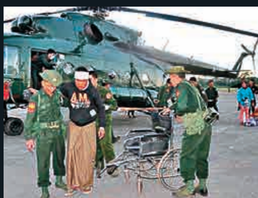
▲緬軍出動直昇機載走傷員