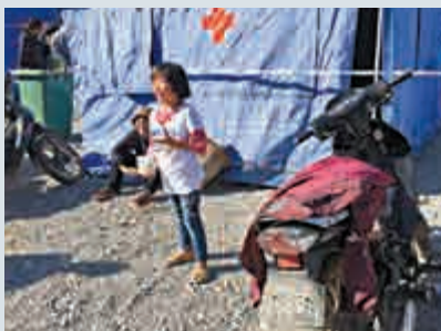
▲來自緬甸的避戰邊民穿上拿到的新衣服