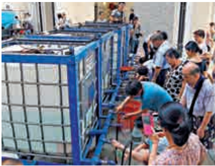
▲去年的鉛水事件，多個公共屋邨被驗出食水含鉛量超標

鉛水事件爆發至今已一年多，11個食水含鉛超標屋邨的居民生活仍受影響。審計署昨日就公屋維修保養和安全問