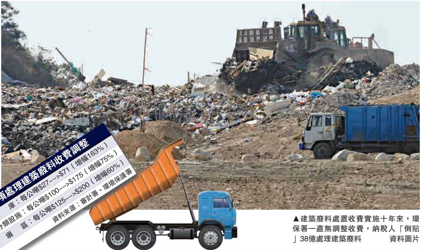
▲建築廢料處置收費實施十年來，環保署一直無調整收費，納稅人「倒貼」38億處理建築廢料 資料圖片

審計署建議，環保署應發出具體指引，確保適時檢控，以符合六個月法定時效規定，並提醒環保署人員，如對違反21天法定時效的個案不採取檢控行動，有關決定須取得適當的環保署人員批註。