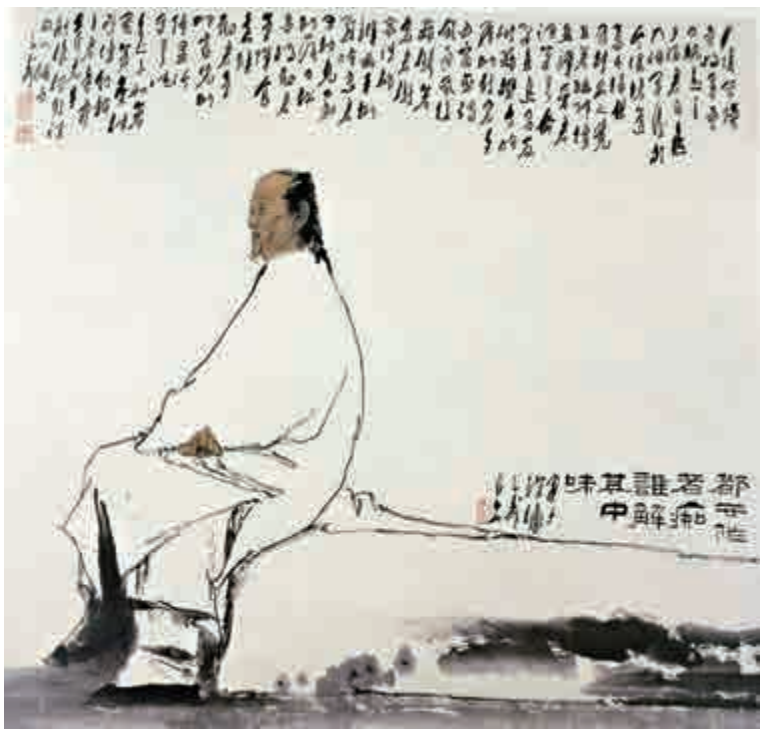
▲《悼紅軒主曹雪芹先生》