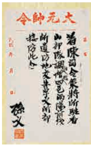
▲展覽中展出以孫中山名義發出的大元帥令

為了讓公眾對孫中山所身處的時代有更全面的認識，展覽亦介紹革命黨人李煜堂和謝繼泰、維新領袖康有為和梁啟超，以至清廷的執政者慈禧太