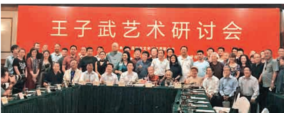
▼王子武藝術研討會現場