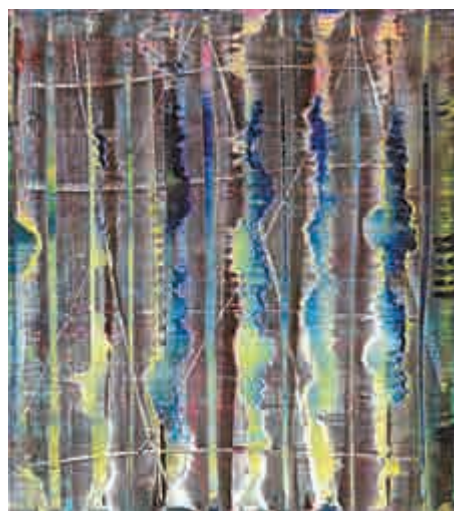
▲Gerhard Richter 一九九二年作《抽象畫第 776-1 號》，估價一千八百萬至二千五百萬港元