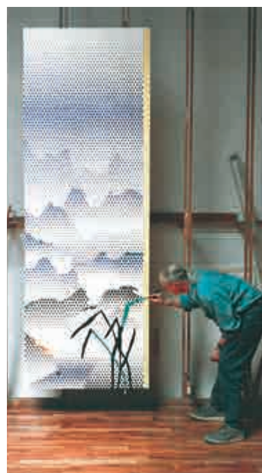
▲Roy Lichtenstein 與其作品《中式山水系列：山水與草》。此畫為二十世紀及當代藝術和設計部晚拍領拍之作，估價二千五百萬至三千五百萬港元。© Estate of Roy Lichtenstein