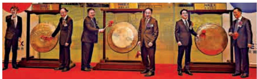
▲若按承銷金額統計，中銀國際在香港新股公開發行市場排名第一位，新股公開發行和後續融資市場則排名第三