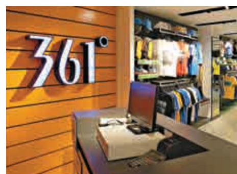
▲361度管理層表示，公司將繼續開拓功能性產品

361度管理層表示，公司將繼續開拓功能性產品，積極投入研發力量，在提升產品功能性的同時，透過創新產品類型，滿足市場需求。截至今年6月底止，361度已擁有194項專利。