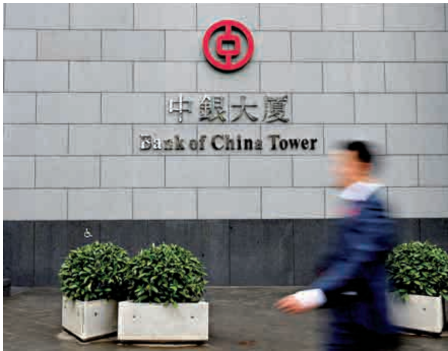
▲中銀國際今年首10月整體業績表現跑贏大市，多項核心業務指標排名，繼續保持前列位置

根據彭博數據顯示，2016年以來，中國銀行集團在中國境外G3貨幣債券市場承銷共執行75筆項目，市場份額達8.44%；由中銀國際執行的項目涉及金額約496億美元（約3868.8億港元）。