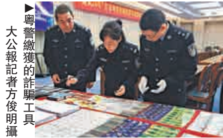
▶粵警繳獲的詐騙工具

【大公報訊】記者方俊明廣州報道：年關臨近，電信詐騙等犯罪活躍。廣東省公安廳29日透露，近日粵警攜手10省市開展「颶風24號」收網行動，搗毀電信詐騙