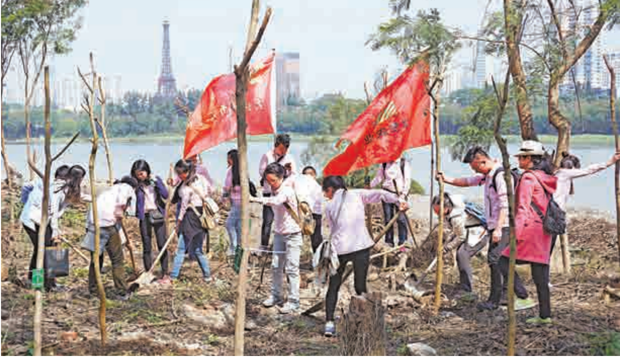
◀國家林業局此前已批准珠三角地區為國家級森林城市群示範區。圖為植樹節期間，深圳市民參加植樹活動網絡圖片

在29日相關會議舉行之之前，內地首個國家森林城市群建設規劃《珠三角國家森林城市群建設規劃》則剛通過了專家評審，相關部門也計劃在完善規劃文本後，將提交廣東省政府審議通過實施。廣東林業部門表示，森林城市群更突出「群」的內涵，將依託山脈、水系等大尺度生態空間，一體化推進珠三角全域自然生態修復，恢復山水林田自然生態關係，促進區域生態整體協調發展。