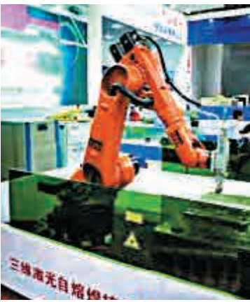
◀東莞智博會上展出的機械臂網絡圖片

由於傳統工廠轉型升級如火如荼展開，本土的裝備製造業今年也發展迅速。截至今年9月，東莞擁有規模以上裝備製造業2111家，從業人員突破100萬人。