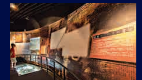
▲十三行博物館現藏文物逾1600件(套)