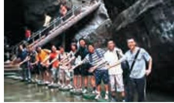
▲「旅友圈」用戶可於線上邀請網友結伴同遊

28日，攜程宣布試水旅遊社交，上線「旅友圈」撮合用戶結伴出行。該公司表示，攜程註冊用戶超2.5億，可利用海量真實數據尋找「志同道合」者結伴旅遊，除可交友，亦可節省旅遊用車用膳等費用。 據悉，攜程此次新推的「旅友圈」可撮合在同一時間、同一目的地的旅遊者結伴交友、線下活動和拼單交易。此外，用戶更可以發布行程計劃和邀請，結伴同遊。(記者 孔雯瓊)