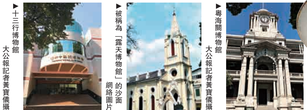
▲十三行博物館 大公報記者黃寶儀攝 ▲被稱為「露天博物館」的沙面 網絡圖片 ▲粵海關博物館 大公報記者黃寶儀攝

廣州與海上絲綢之路可謂源遠流長。早在秦漢時期，廣州已開闢了海上絲綢之路的航線，唐代《廣州通海夷道》是當時世界上最長的航線，明代廣州是中國朝貢貿易第一大港，清代十三行是海上絲綢之路發展的巔峰。廣州與海上絲綢之路的故事，亦基本圍繞着珠江發生，而位於珠江畔的十三行博物館、粵海關博物館、廣州郵政博覽館、廣州錦綸會館、廣東民間工藝博物館和沙面等更形成一個博物館群。目前，這些「海絲」瑰寶將根據規劃，聯合打造成一個世界級的文化旅遊區。