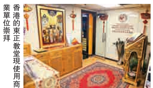
業單位崇拜 香港的東正教堂現使用商

直至一九九六年，君士坦丁堡牧首區在港建立香港及東南亞都主教教區，繼承傳教工作。二〇〇三年，莫斯科宗主教區亦決定復建教會。由於信眾來自不同國家，舉行禮儀時要使用多種語言，前者以希臘語為主，後者以俄語為主，並加插英文和中文。