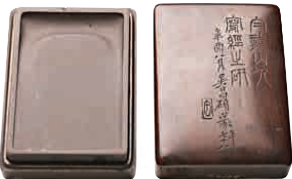
▲「端石王震寫硯」是名人硯銘的代表之一 廣東省博物館供圖 ▲廣東省博物館鎮館之寶——「清末廣東三大名硯」之千金猴王硯 廣東省博物館供圖