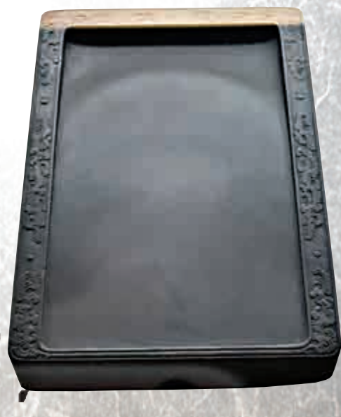
◀清光緒端石桐葉硯（老坑石） 大公報記者黃寶儀攝 ▶清乾隆端石變紋長方硯（老坑石） 大公報記者黃寶儀攝 ▼清乾隆端石居巢作畫硯 大公報記者黃寶儀攝