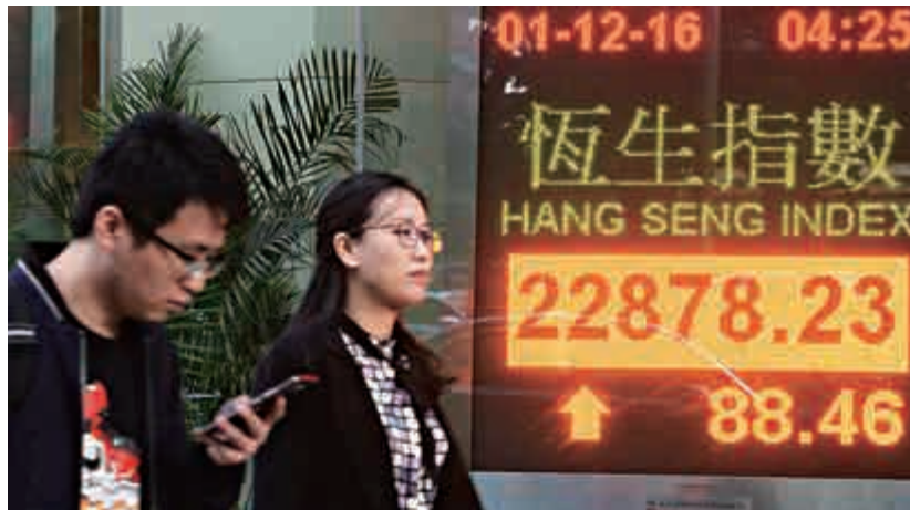
▲恒指昨日曾突破二萬三關，惟其後升幅縮窄，收市報22878點