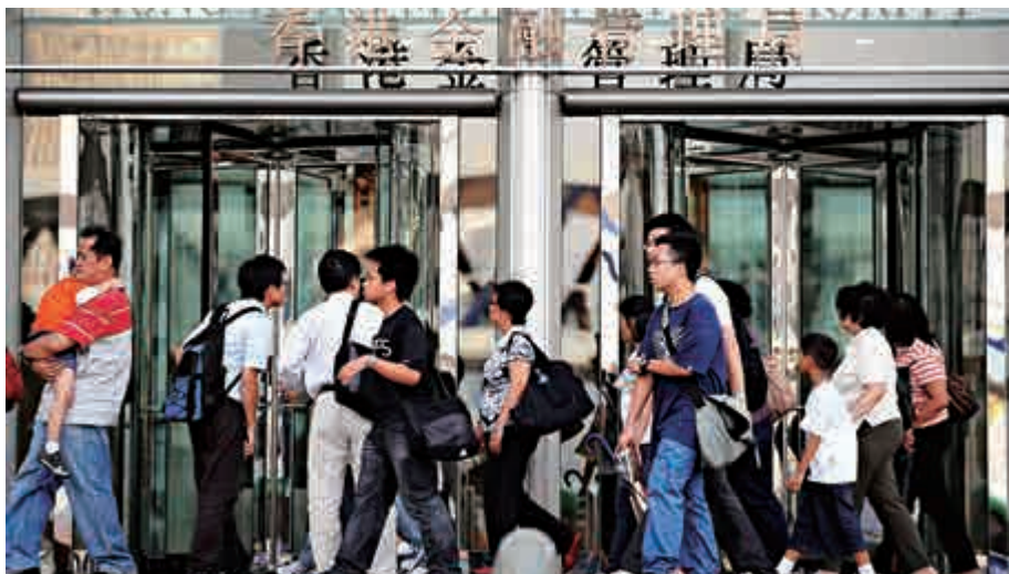
▲為提升外匯基金回報，金管局將繼續增加「長期增長組合」的投資總量，並正密切留意幾項投資主題 資料圖片

當局重申，基於國際投資環境持續回報低、波動大，預期外匯基金投資回報及財政儲備的利息收入亦可能受到影響，但強調保持香港貨幣金融體系的穩定健全，為外匯基金的特性，並非一般投資基金或主權基金以爭取高回報為目的，故會繼續小心謹慎作出適當投資部署，同時推進多元化投資步伐。