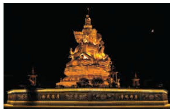
▲景區供奉一座高八米、漢白玉陰刻的四面觀音