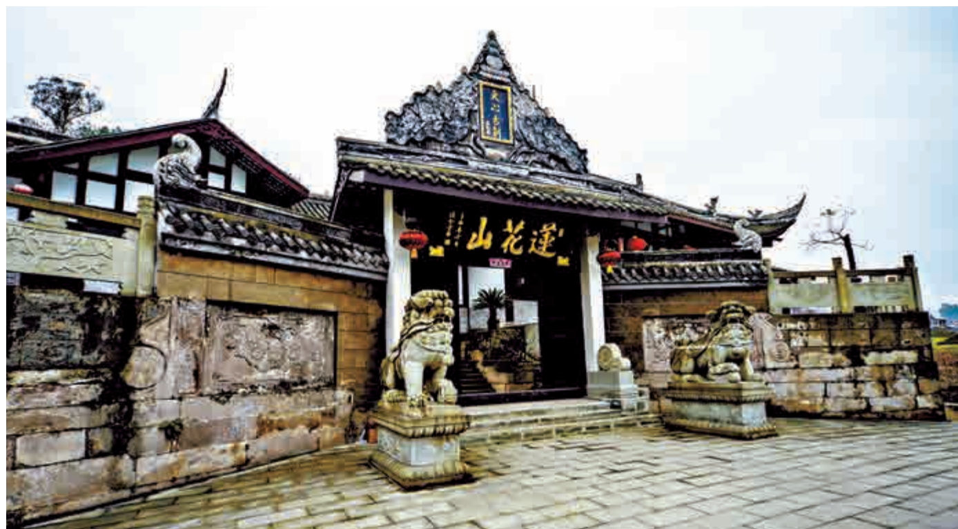
►修復後的古文化遺跡——天心古剎