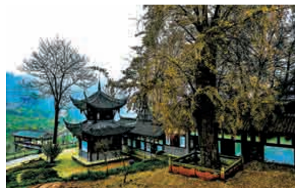
▲天心寺內一棵有一千二百年歷史的雌雄同株古銀杏樹