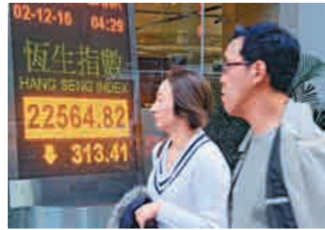
▲港股昨日顯著回吐313點，全周則累跌158點

另外，高盛調低中資股評級，由「增持」降至「中性」，同樣看好A股多於H股。高盛稱，中資股明年盈利會反彈至8%，屬於過去四年高位，但在息口向上的環境下，估值向上空間有限，尤其是新經濟股。該行把能源、日用消費股評級上調至「增持」，科技股則降至「與大市同步」。