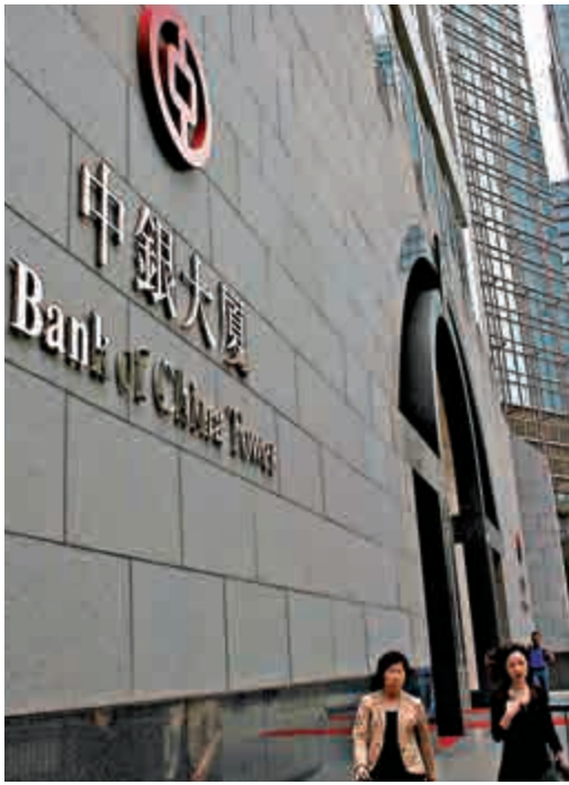
▲深港通將於下周一正式開通，中銀國際已準備就緒，為深港通提供全面、優質、專業的「一站式」服務

最多的中資投行之一，中銀國際長期為境內外客戶提供全方位金融服務，截至今年11月末，中銀國際在香港新股承銷市場排名第一，同時在香港股票交易、境外債券發行、香港強積金等市場保持領先地位。