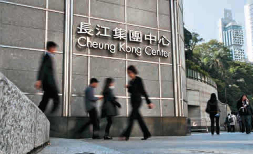
▲長實地產向長和收購飛機租賃業務，市場人士認為今次交易是「左手交右手」，其管理層亦指「無話邊個着數咗」