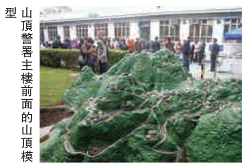
山頂警署主樓前面的山頂模型

是次開放只有五天，三千張門票很快便派完，令許多市民向隅。希望有關方面日後繼續開放，讓更多人有機會進入這座特色警署，了解警隊一百七十年來的歷史。