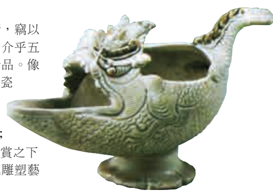
附圖，就是那時南方窯燒的白瓷塑龍杯。

其實，說到白瓷雕塑藝術，竊以為比較獨特而另具風格者，乃介乎五代至北宋期間所塑燒的一些珍品。像附圖，就是那時南方窯燒的白瓷塑龍杯。造型誇張大膽，帶點神話色彩，特別是口部下長長地兜出，配合上方一排尖齒；表面上惡形惡相具威勢，但細賞之下，卻感趣怪可愛和有創意，把雕塑藝術和日常用器結合一體。本來，那時瓷器有「南青北白」之稱；此器竟出自自南方窯，卻非南人製的青瓷，而又能如此精美，實屬異數。