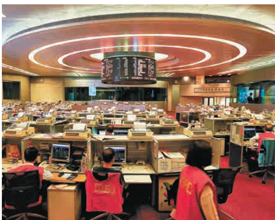
▲近期多隻半新股及新股皆出現大上大落

至於由上市後就「唔識跌」的膳源，昨日終於回吐，收報10.84元，跌36.53%或6.24元。CMON(08278)首日創業板上市爆升13倍後，就一直大幅下跌，昨日再跌近四成，收報0.249元，接近打回原形。