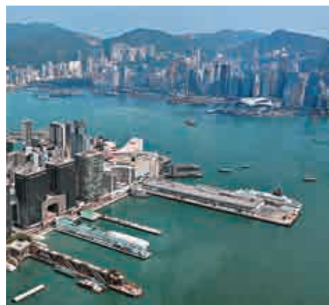
▲有調查顯示，半數受訪者預期香港作為亞洲金融中心的地位將被取代 資料圖片