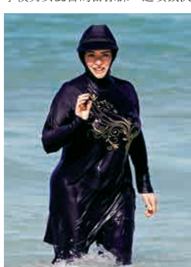
▲ 穆斯林女性的泳裝「布堅尼」 網上圖片

【大公報訊】據世界新聞網報導：德國最高法院7日裁決，即使是極端保守的穆斯林女孩也不能不上學校男女混合的游泳課。這項裁決