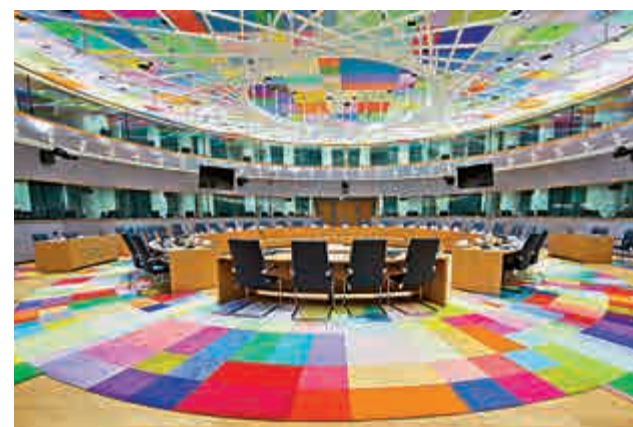
▶ 位於歐盟新總部正中央的大型會議廳 網上圖片