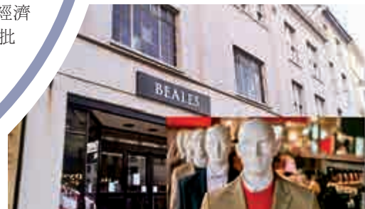
▲ 遭盜竊的英國百貨公司「Beales」

這起案件被認為是一場「精心策劃的犯罪」。警方呼籲知情者提供任何信息。店員則表示，難以想像這些盜賊們能跟那些人體模特站在一起，一整天都紋絲不動，「不能打噴嚏，感到癢癢也不能抓。」