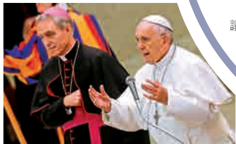
▲ 教皇方濟各7日在梵蒂岡發表講話

方濟各說，「它只報導單一立場的意見，同時卻省略另一面的真相」，那麼就不能期待讀者可以對任何情況都做出「嚴肅判斷」。