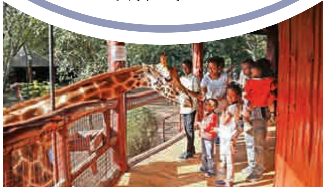
▲ 肯尼亞一個保護中心的長頸鹿

不僅如此，「太空蛋」的高額經濟投入也遭到了歐盟成員國領導人的批評。英國時任首相卡梅倫在2011年將其形容為一個為領導人建造的「鍍金的籠子」，而當時的緊縮政策正在為遭到債務打擊的歐洲大陸帶來打擊。