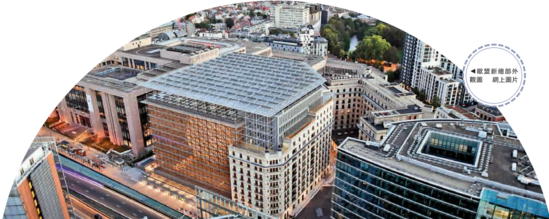
◀ 歐盟新總部外觀圖 網上圖片