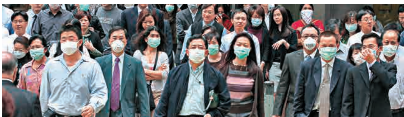
▲沙士期間人人都戴口罩防「毒」，潘烈文率先破解首個沙士冠狀病毒序列，為抗疫帶來曙光

被譽為「港大醫學院抗沙士六子」之一的香港大學公共衛生學院教授潘烈文，一直是「反播毒」先鋒。他在沙士（非典型肺炎）散播期間，是率先破解首個沙士冠狀病毒序列的學者，近年更積極投入中東呼吸綜合症的有關研究。潘教授多年來「掃毒」有功，近日獲得2017至2018年度裘槎基金會「裘槎優秀科研者獎」。