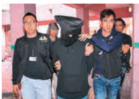
▲警方在將軍澳拘捕涉嫌旺角暴亂的青年

之稱的容偉業等共10人一案，早前已正式轉介到高院，排期於2018年1月15日至5月14日審訊。另有11名涉案分別被控暴動、刑毀等共14項控罪的男女被告，案件亦已轉介區域法院審理。警方早前指出，案件轉到高等法院審理，反映旺角暴亂事件的嚴重性。