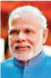
第九名 印度總理 莫迪 (66歲)