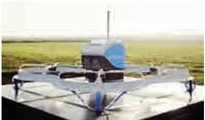
▲亞馬遜用於送貨的無人機

目前，無人機運送貨物的體積和重量也有一定規格限制，重量最高為5磅。亞馬遜稱，希望未來數月能讓服務覆蓋這一配送設施周邊的更多家庭用戶，目標是在30分鐘內即完成配送。