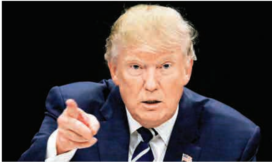
▲美國候任總統特朗普

此外，今年的榜單中有28人是大型企業的行政總裁。據《福布斯》報道，這些行政總裁中排名前十的都是美國人，他們所經營的公司總市值為3萬億美元。