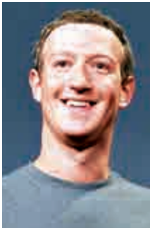
第十名 Facebook行政總裁 朱克伯格 (32歲)