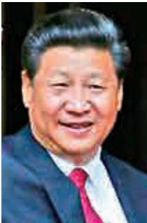
第四名 中國國家主席 習近平 (63歲)