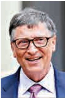
第七名 微軟創始人 比爾蓋茨 (61歲)