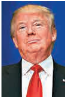
第二名 美國候任總統 特朗普 (70歲)