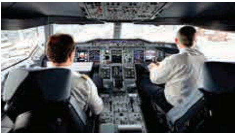
▲哈佛研究顯示，逾一成民航機師存在抑鬱症問題

有英國機師協會人士指出，對於機師群體的壓力和工作狀況應表示支持與諒解，以幫助他們勇敢面對問題。艾倫則表示，今次結果需要得到航空業界的關注，同時，針對許多航空職務人員的健康狀況的審查和合適的治療亦是十分必要。