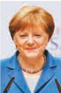
第三名 德國總理 默克爾 (62歲)