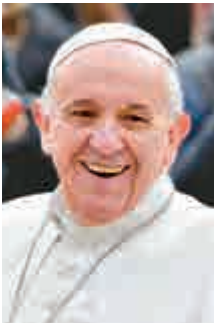
第五名 教皇 方濟各 (79歲)