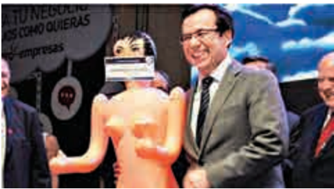
▲智利經濟部長塞斯佩德接受禮物充氣娃娃

智利總統巴切萊特發推文稱，這種禮物公然冒犯政府努力促進尊重女性的工作目標。她寫道：「我想除了請求諒解之外，此事反映出智利國內依然存在大男子主義和性別歧視現象，在一些問題上甚至還有厭惡女性的情況。」而塞斯佩德晚些時已就此事道歉。