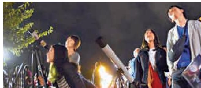
◀日本京都嵐山法輪寺舉行的「宇宙節」中的天文觀察會現場

日本國立天文台副教授縣秀彥說，「天文作為愛好已變得更隨意。」他分析稱，媒體的報道使人們了解到更多天文信息，而將觀察夜空作為愛好來享受樂趣的女性人數也因此增加。