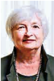
第六名 美聯儲主席 耶倫 (70歲)