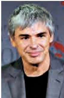
第八名 字母表行政總裁 拉里佩奇 (43歲)