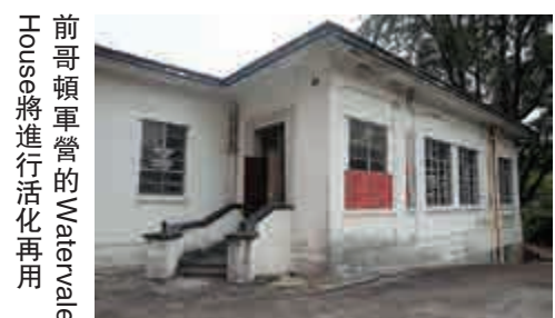
前哥頓軍營的Watervale House將進行活化再用

Watervale House的歷史比哥頓軍營還要長，古蹟辦將之納入新增評級名單，評為二級歷史建築。它逃過被拆卸的命運，發展局把它推出供非牟利機構活化，日後大眾將有機會走入這座大宅，一睹昔日軍官會所內貌。