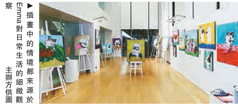
插畫中的情境都來源於Emma對日常生活的細微觀察。