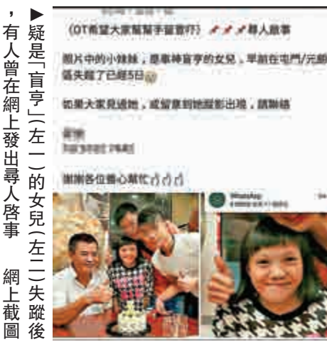
疑是「盲亨」(左二)的女兒(左三)失蹤後，有人曾在網上發出尋人啟事

救護員接報到場，將陷於昏迷的梁送院搶救，惜最終證實不治，警方經初步調查後，懷疑事主因病致命，並無可疑，真正死因則有待剖屍驗證。