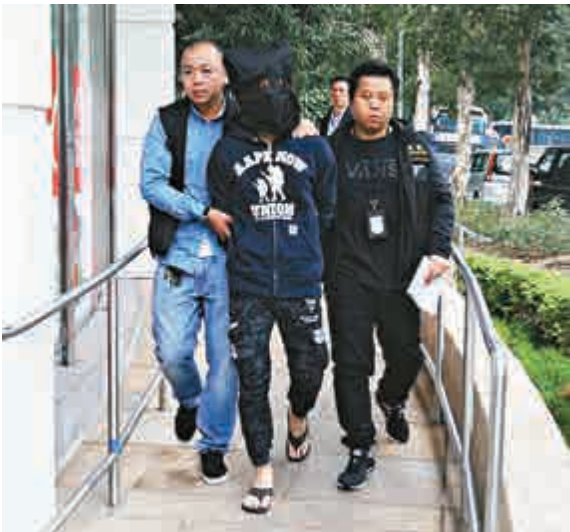
▲警方進行「高山行動」打擊非法收數活動