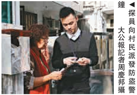
探員向村民派發防盜警鐘

另訊，警務處處長盧偉聰昨日表示，本港今年首十個月錄得1999宗爆竊案。其中，豪宅爆竊佔42宗，逾半是保安不足，未鎖好門窗。十個月共有364人被捕，66%是本地人，24%是持雙程證內地人，10%是非華裔人士。他補充，留意到有內地爆竊集團派人來港犯案，會繼續加強與內地機關情報交流，並派員在黑點巡邏埋伏，會積極與物管公司及保安員合作，希望屋苑安裝警報器及閉路電視。