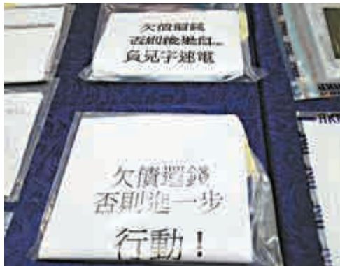
▼行動中檢獲的證物