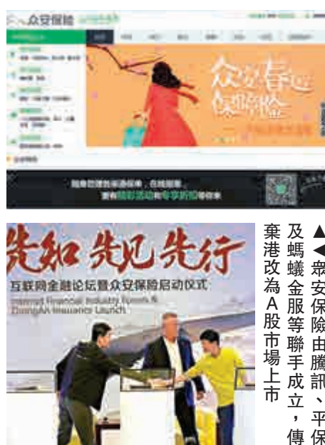
▲眾安保險由騰訊、平保及螞蟻金服等聯手成立，傳香港改為A股市場上市

香港機電工程服務公司順興集團（01637）昨昨日招股，根據6間券商的資料，合共累計為順興借出3.6億元孖展額，相當於公開發售集資1250萬元計，超額認購27.8倍。