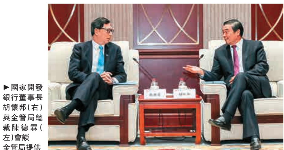
▲國家開發銀行董事長胡懷邦（右）與金管局總裁陳德霖（左）會談