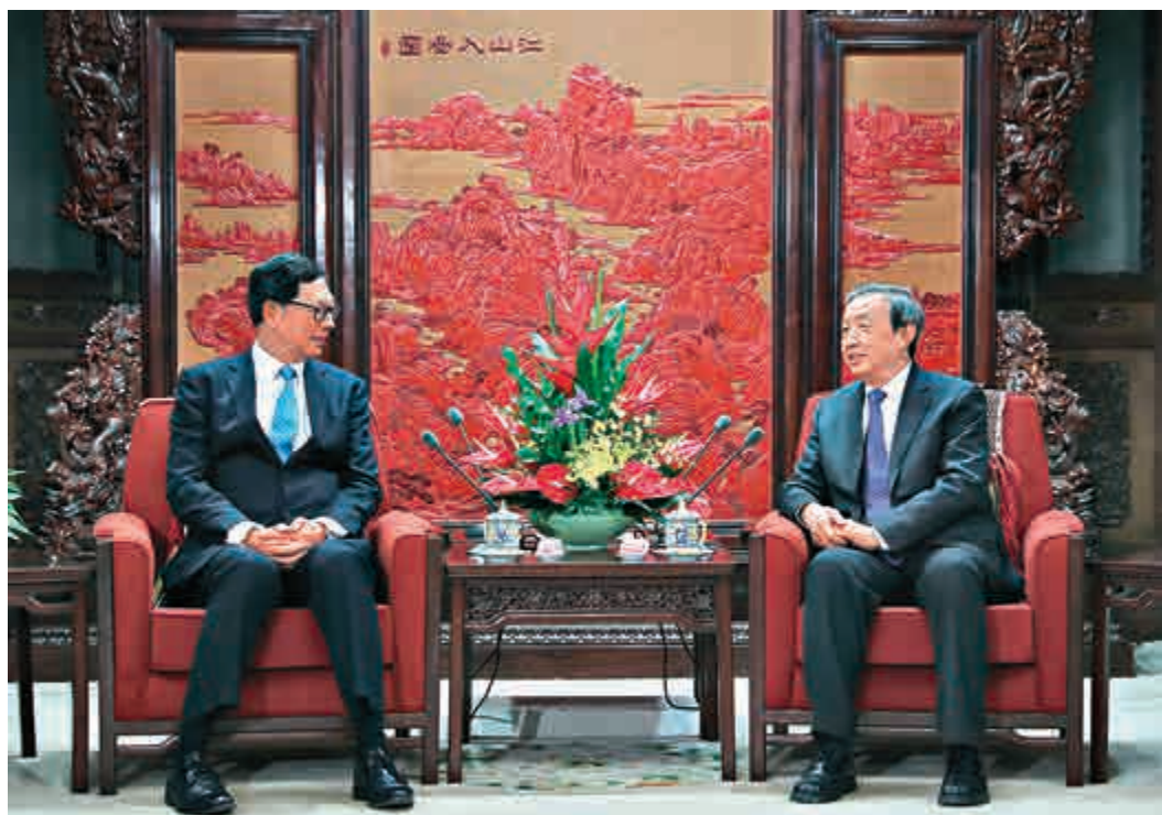
▲國務院副總理馬凱（右）12月20日在北京中南海紫光閣會見香港金融管理局總裁陳德霖（左）率領的香港銀行公會代表團