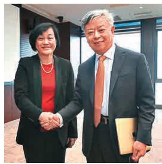
▲香港銀行公會主席陳秀梅（左）與亞投行行長金立群握手