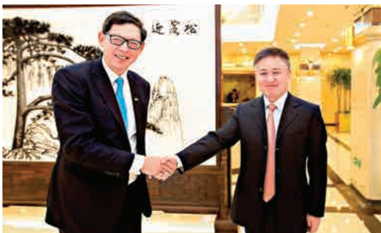
▲金管局總裁陳德霖（左）與中國外匯管理局局長潘功勝握手