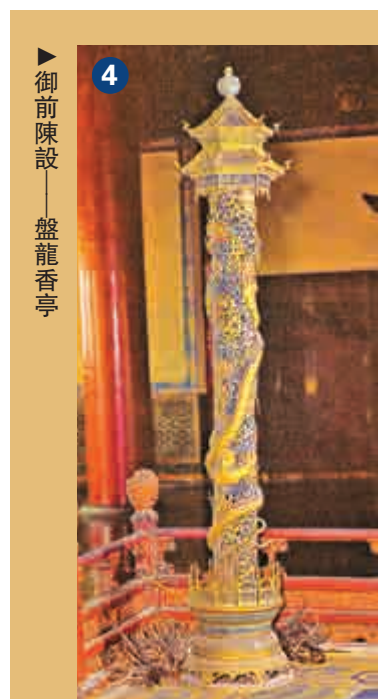
▲御前陳設——盤龍香亭