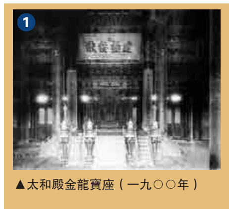
▲太和殿金龍寶座（一九〇〇年）

走進太和殿，首先映入眼簾的，就是那張造型、裝飾都極盡華麗的雕龍金漆大椅——皇帝寶座。它高高坐落在大殿中央的須彌座式平台上，與殿內的各種裝修、陳設互為呼應，相得益彰。（圖一）