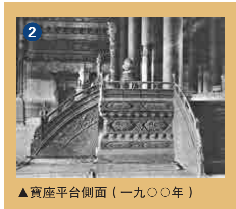
▲寶座平台側面（一九〇〇年）

平台為楠木製作，外髹金漆——將金粉摻入膠液塗於器物，然後刷漆。四周為宮殿基座形式，雕刻有精美的蓮花紋飾，並且鑲嵌大量寶石。平台正面三出階（即設置三道台階），專供皇帝升座時使用；左右各一出階，以備執事、侍衛等上下之需。平台之上，後部設金漆屏風，從上到下，布滿金龍浮雕圖案。紫禁城內的屏風，都是三扇或五扇，惟獨這裏多達七扇。何以如此？按照陰陽五行的說法，偶數為陰，奇數為陽，「九」是陽數之極，只有皇帝才能使用。在太和殿中，早已將皇帝至尊的觀念發揮到了極致，按理屏風也應該用九扇才更為合適。但從審美的角度看，九扇屏風無論如何都很難達到理想效果，於是就稍做變通，使用七扇，以顯示太和殿地位的與眾不同。（圖二）