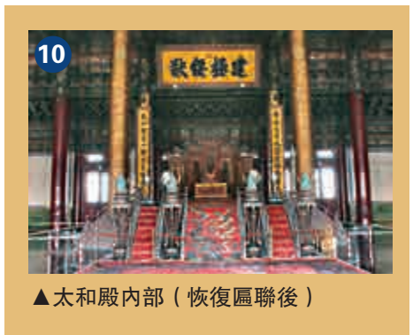
▲太和殿內部（恢復匾聯後）

直到二〇〇二年，故宮博物院決定恢復宮廷史跡，才按照一九〇〇年的歷史照片複製了全部匾聯。至此，太和殿內部布局終成完璧，再現了昔日神采。（圖十）