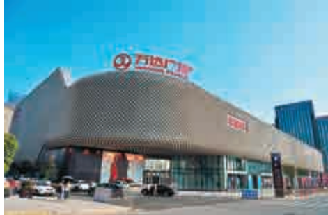
萬達富力5年內共投資300億元，開發25個商業綜合體項目

阿里巴巴集團在年貨節期間繼續創新公益模式，為村民免費送出一萬份村淘定製的全家福相片，又發起員工認捐15萬片磁力片的活動，捐贈給黑龍江、內蒙古、江西等13個省21個縣農村淘寶所在村點的5000名留守兒童。