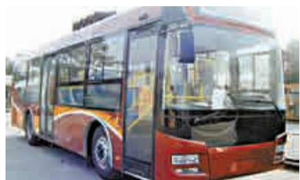
中興看好廣通客車的技術實力 資料圖片

除了收購廣通客車，中興還計劃在珠海建立智能汽車製造基地。該智能汽車製造基地落戶珠海金灣區，佔地面積約1200畝，總投資146億元，分兩期建設，完工後將形成年產新能源客車整車1萬輛、新能源專用車2萬輛的生產能力。