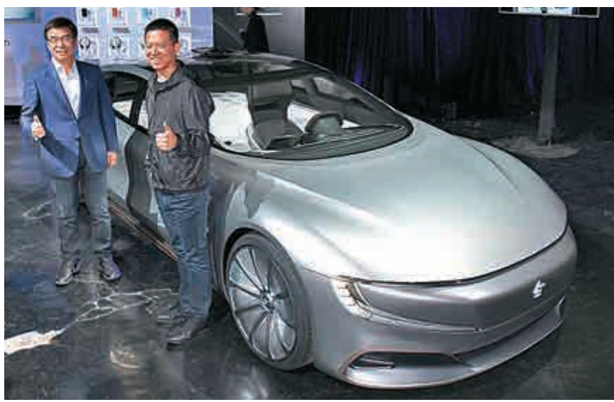
樂視將於明年1月初發布「史上首款互聯網生態電動車」資料圖片

報道指，Faraday Future遭供應商Futuris入稟洛杉磯高級法院，指控Faraday Future拖欠超過款項1000萬美元（約7800萬港元），當中有近700萬（約