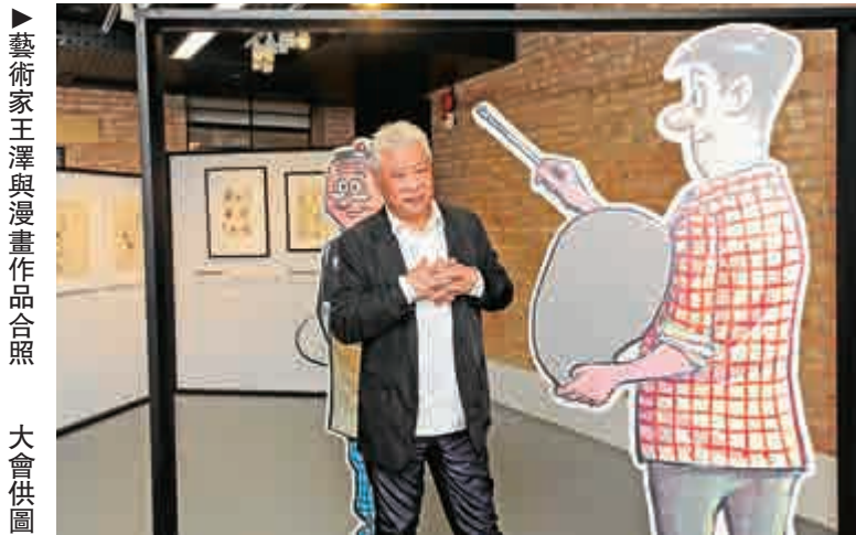
藝術家王澤與漫畫作品合照