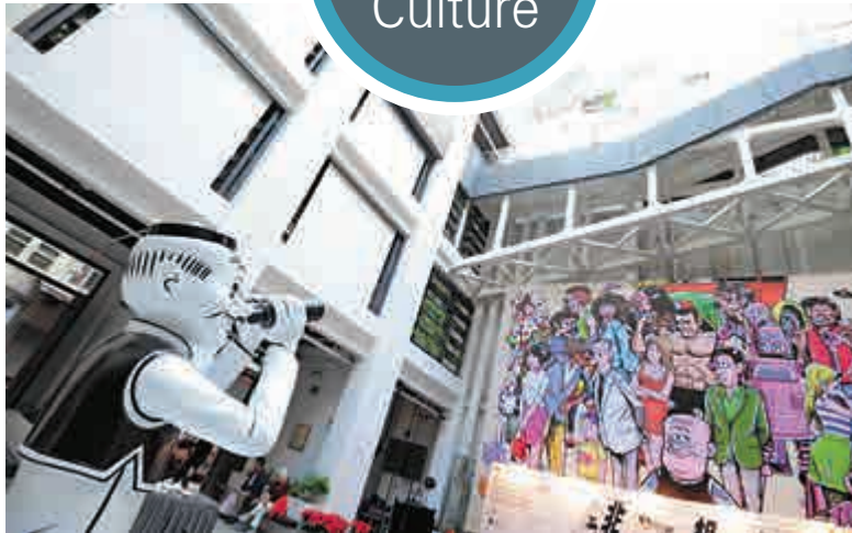
地面公眾休憩空間的老夫子塑像拿着望遠鏡遙望故事中角色