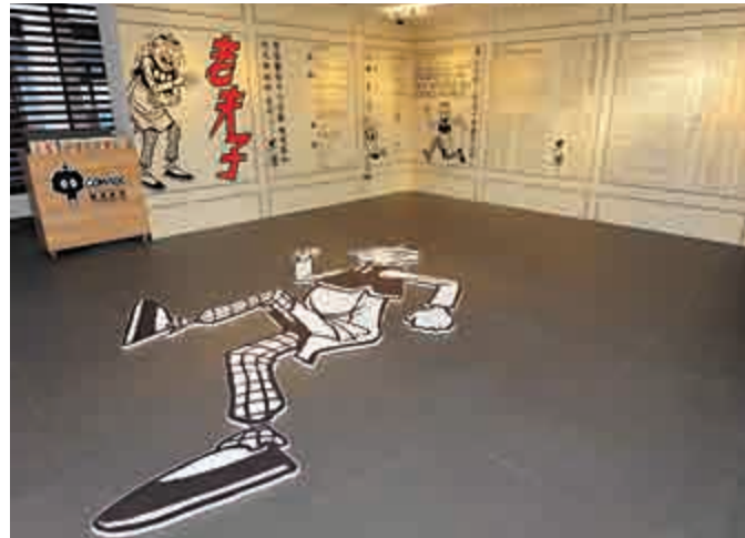
三樓展覽廳向公眾展示《老夫子》的漫畫作品