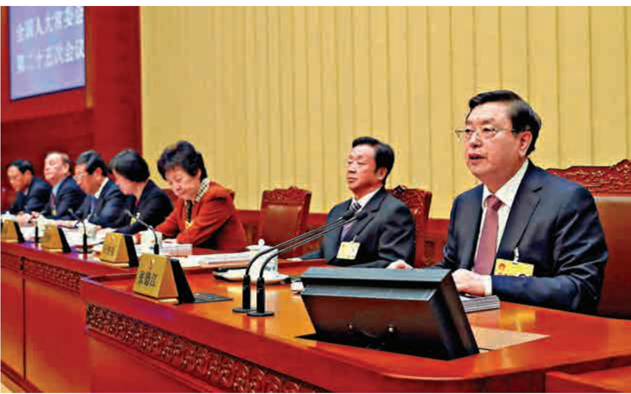
◀25日下午，十二屆全國人大常委會第二十五次會議在北京人民大會堂閉幕。張德江委員長主持會議。

另據了解，日前，全國政協主席俞正聲主持召開了政協第十二屆全國委員會第五十二次主席會議，審議通過了《關於召開中國人民政治協商會議第十二屆全國委員會第五次會議的決定》（草案），建議全國政協十二屆五次會議明年3月3日在北京召開。