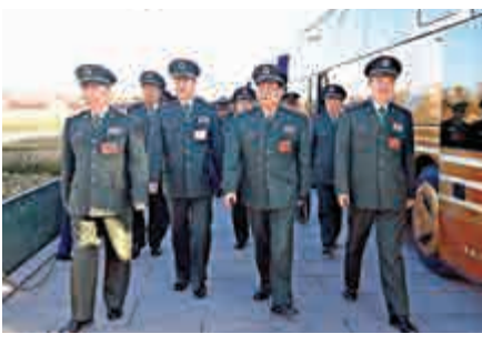
▲今年全國兩會期間，解放軍代表步入人民大會堂。

【大公報訊】記者江鑫嫻、凱雷北京報道：全國人大常委會25日表決通過《關於軍官制度改革期間暫時調整適用相關法律規定的決定》指出，在軍官制度改革期間暫時調整適用相關法律。該決定自2017年1月1日起施行。