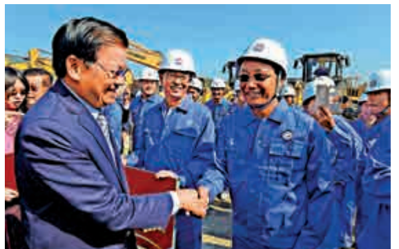
▲25日，在老撾勐拉邦，老撾總理通倫（左）在開工儀式上與中方員工握手。

年，總投資近400億元人民幣（約合447億港元），由中老雙方按70%和30%的股比合資建設。這條鐵路是第一個以中方為主投資建設、共同運營並與中國鐵路網直接連通的境外鐵路項目，全線採用中國技術標準、使用中國設備。