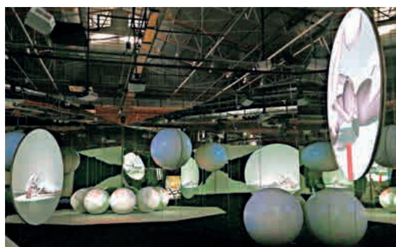
Yves Netzhammer和Bernd Schurer的作品《雲的陵園》