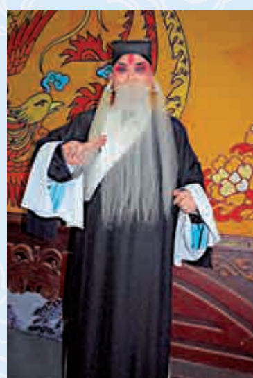
本港心臟科名醫王壽鵬演出《文昭關》