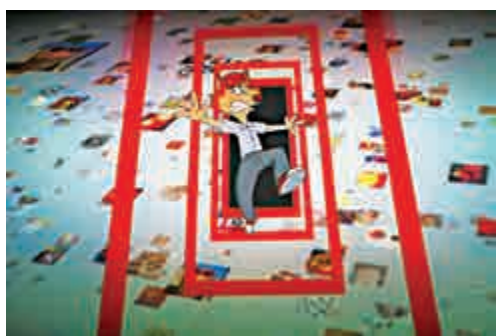
Ed Formieles作品《精神：肉身盛宴》