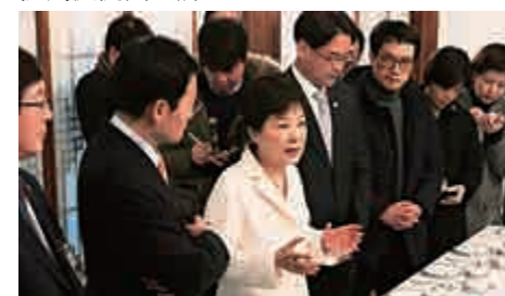
▲韓國總統朴槿惠（左一）1日在首爾公開現身

另一方面，韓國當局三日表示，他們將採取措施，引渡「閩密門」主角崔順實之女鄭尤拉，但鄭尤拉的丹麥律師矢言，將對引渡判決提出上訴。