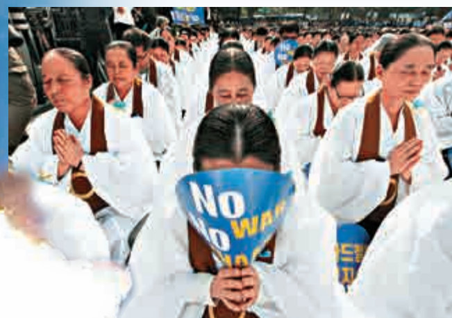
▲韓國民眾在首爾示威反對部署「薩德」