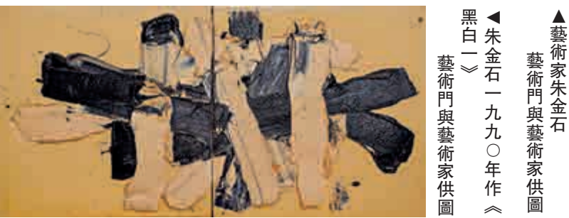
▲藝術家朱金石 朱金石一九九〇年作《黑白一》