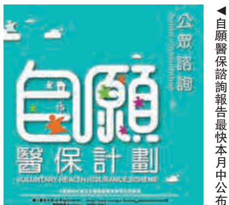
▲自願醫保諮詢報告最快本月中公布

【大公報訊】推動自願醫保計劃困難重重，有消息指政府於本月中公布自願醫保諮詢報告，計劃率先落實十項最低要求，期望明年上半年能夠推出計劃。