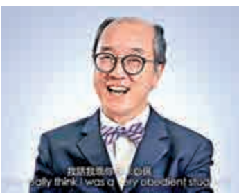
▲陳繁昌拍片玩「你問我答」，與學生加強互動

香港科技大學校長陳繁昌貼近年輕人口味，拍片大玩最近潮興嘅「你問我答」，仲放係科大的Facebook，一於與同學打成一片。