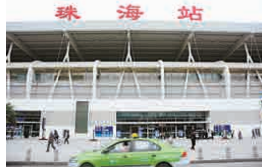
▲珠海可通過鐵路直達全國22個城市。圖為珠海站。