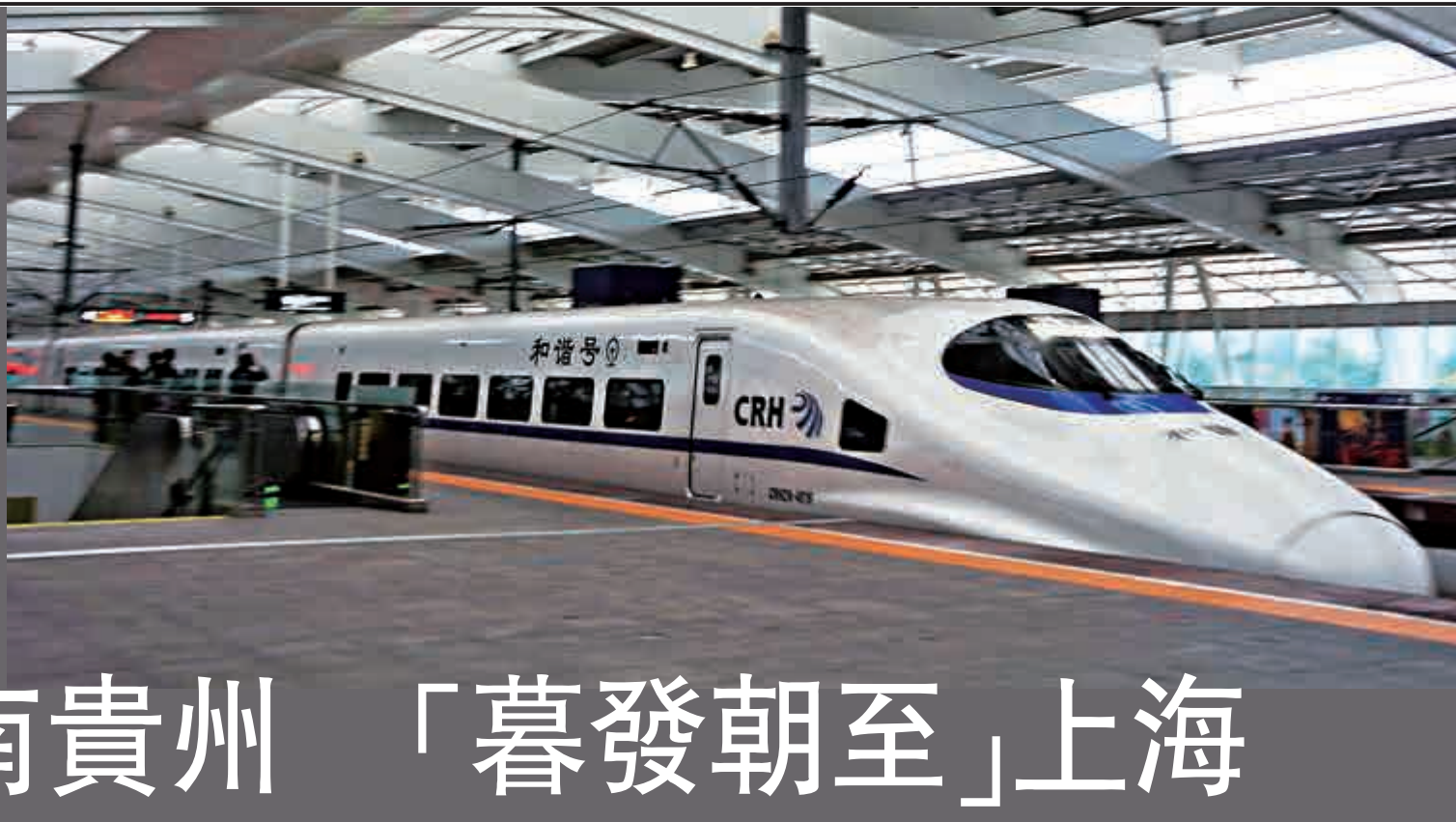
▲珠海5日起陸續開通到貴陽、長沙、上海三條省外高鐵路直達專線。圖為珠海至貴陽D2808次列車。