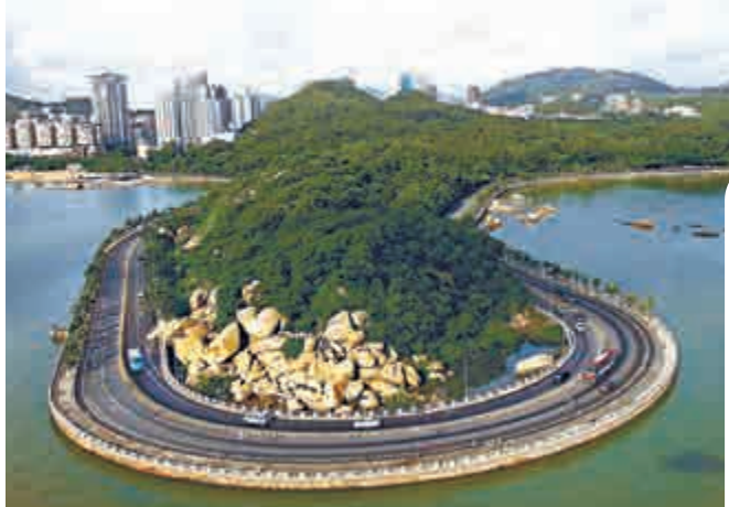
▲珠海高鐵路網加速延伸，助力珠澳旅遊發展。圖為珠海著名的情侶路。