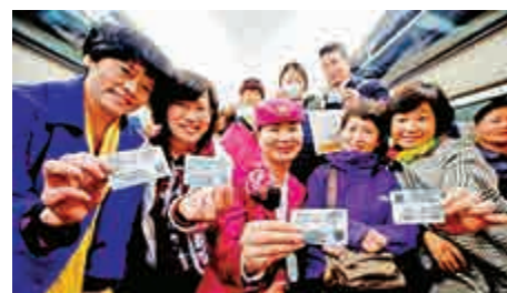
▲5日，在南昌西客站，首批乘坐南昌至昆明首發高鐵的旅客展示車票。

此外，深圳北站新增開行2對G字頭動車組列車，屆時從深圳出發乘坐動車組列車可以直達昆明，將由原來的29小時縮短為7小時左右。