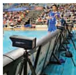
◀中國排球聯賽中的「鷹眼」設備與國際賽場不同