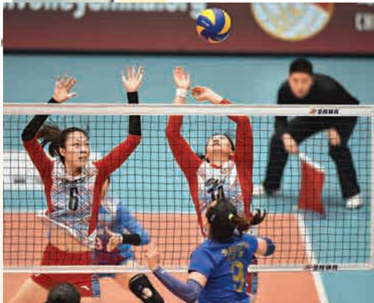
◀未有「鷹眼」系統之時，邊裁（右一）更需金睛火眼地觀看每一球

從開賽首輪到聯賽第二階段，圍繞「鷹眼」的負面聲音不絕於耳。回放等待時間過長、畫面質量不佳、裁判判罰跟「鷹眼」回放有差距等，更有甚者認為「鷹眼」或有被人為做手腳的痕跡。有的球從電視轉播慢動作看十分接近底線，但「鷹眼」回放後卻相差很遠，這究竟是真實的畫面回放，還是人為安排好的結果便不得而知。