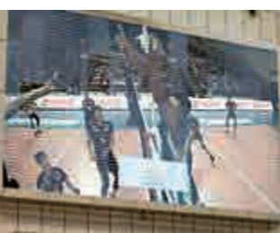
◀「鷹眼」系統使用的本意是保證比賽公平性