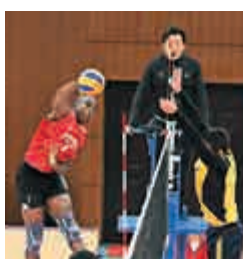
◀「鷹眼」系統可助主裁判（中）作最後判決