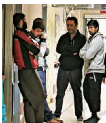
死者的親友聞訊趕赴醫院，聞噩耗傷心不已。

事後現場遺下大灘血跡，警方封閉其中三條車線展開調查。警方西九龍交通部特別調查隊第一隊主管容百權高級督察證實，死者因為宗教信仰，已經向運輸署申請豁免戴頭盔，並獲批准，現正調查意外是否有人衝紅燈引致。他呼籲市民如目擊車禍經過，可致電西九龍交通特別調查隊：3661 9000。