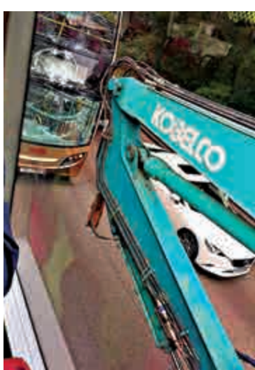
▲荃灣有九巴撼撞前行貨櫃車拖架上凸出的伸縮臂

【大公報訊】藍田鯉魚門道上周六發生1死18傷翻巴士車禍後，昨午又發生涉及巴士的交通意外，一輛雙層九巴沿荃灣路行駛期間，收掣不及，撼撞前方一輛由貨櫃拖架載運的吊臂車凸出車尾部分，巴士車頭擋風玻璃破裂，車長與車上五名男女乘客均受傷送院。警方正調查巴士車長事發時的身體狀況及肇因。