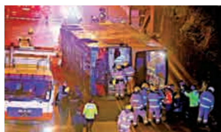
▲上周六藍田有城巴翻車導致1死18傷意外 資料圖片

【大公報訊】藍田城巴翻車導致1死18傷意外，肇事兼職車長被指患高血壓，事發時頭暈失去知覺。新巴城巴發言人昨晚發表聲明稱，全職及兼職車長的身體檢查制度、涵蓋範圍及標準完全相同，50歲或以上車長每年須接受身體檢查。任職至65歲退休年齡的全職及兼職車長，如能通過身體檢查，可獲合約形式聘用一年，之後可再以合約形式聘用至68歲，但須每半年接受身體檢查，以確定適宜駕駛。