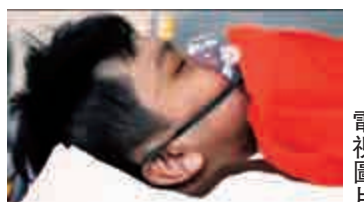
▲遭刀手斬傷的青年送院救治

【大公報訊】北角鬧市昨晨發生斬人血案，一名任職金融行業的青年，途經電氣道與油街交界時，遭一名持牛肉刀男子衝前狂劈，背部中多刀，受傷倒地。兇徒傷人後逃逸，一名剛在民安隊完成訓練的年輕女隊員見義勇為，上前協助傷者急救，並與傷者保持交談免讓他入睡。案件交由警方反黑組接手偵辦。