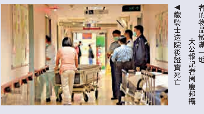
事後現場遺下大灘血跡，死者的物品散滿一地。