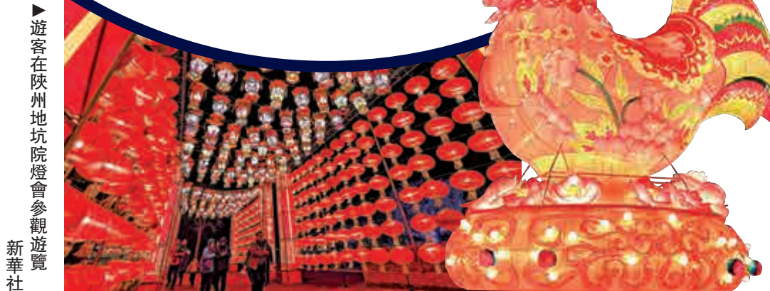
▶遊客在陝州地坑院燈會參觀遊覽 新華社