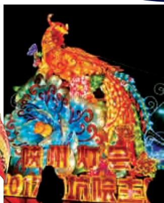
▲「錦雞報春」融合陝州甘 山錦雞和傳統鳳凰構圖因素 ▲「五穀豐登」燈組寓意雞 年陝州區將喜獲豐收