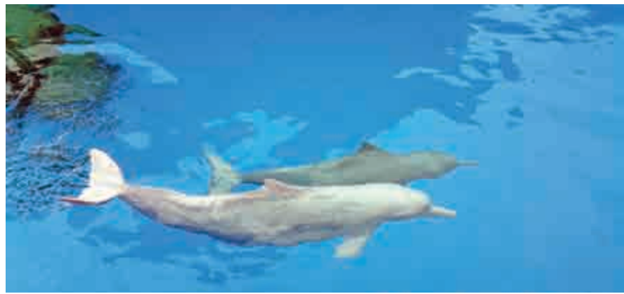
▲長隆海洋王國內兩條新來的中華白海豚