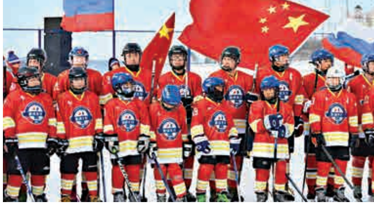
▲首屆中俄界江冰球友誼賽啟幕 大公報記者于海江攝

比賽分為中俄兒童和中俄青年 冰球隊比賽，賽事歷時兩天，吸引 了衆多兩國人民在江邊駐足觀看。 (記者 于海江)