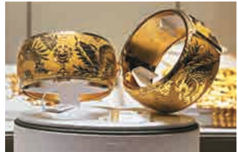
▲金價充當資金避難所，倫敦現貨金價曾升0.4%，至每盎司1201美元