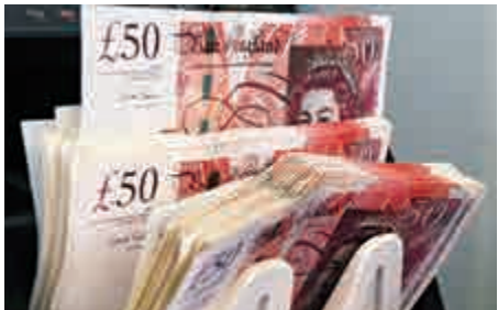
▲自英國去年6月公投脫歐以來，英鎊兌美元貶值19%

外媒引述消息人士報道，英國政府計劃在文翠珊發表脫歐講話後，嘗試去安撫投資者。據消息透露，政府官員預計當文翠珊周二發表其有關英國脫歐時，英鎊匯率應會受到衝擊，英國財政部因而準備向倫敦大型銀行發表講話，嘗試緩和市場波動。雖然財政部經常與銀行解釋政策，但由首相辦公室預期市場反應將會激烈，是