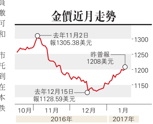
▲金價充當資金避難所，倫敦現貨金價曾升0.4%，至每盎司1201美元

雖然較低風險的德國債券息下跌，但是意大利的債息卻上揚，原因是評級機構DBRS在上周五收市後調低了意大利的信貸評級，令壞帳疊疊的意大利銀行，借貸成本進一步增加，意國銀行以該國主權