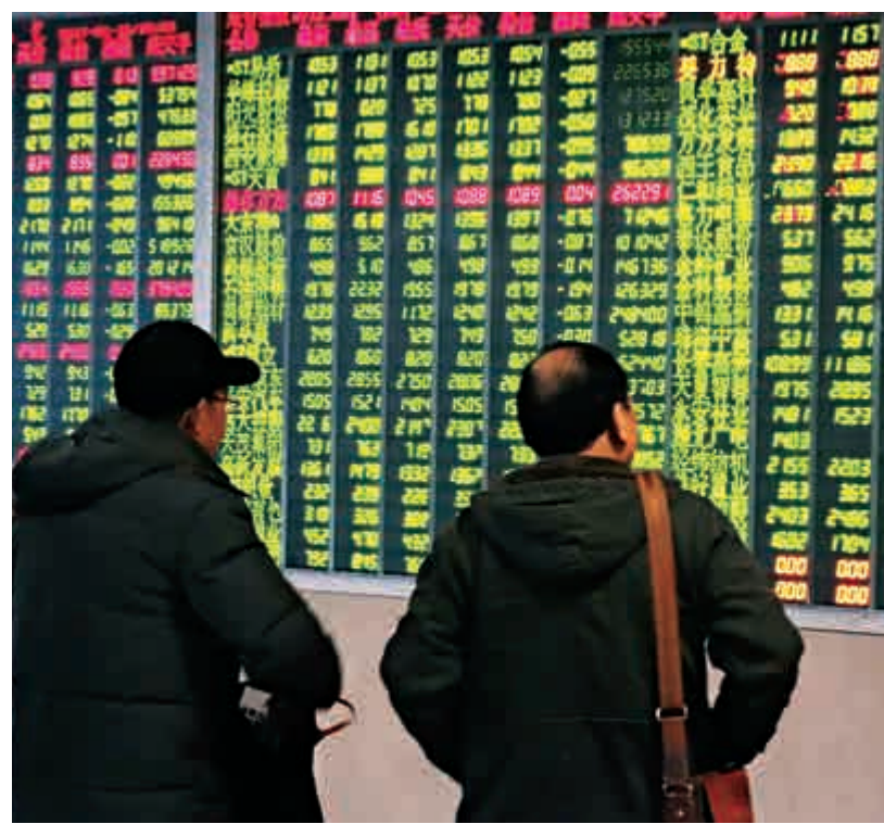
▲三大指數昨日下午兩點過後恐慌情緒突然被引爆，急速插水。其中，滬綜指最多跌逾2%，深成指跌5%，創業板指下行超6%

創業板昨日盤中插水逾6%，廣州萬隆認為，本輪跌市中市場系統性風險集中在中小創，所以只有創業板止跌企穩，市場恐慌情緒才能得到根本緩解。既然這一輪殺跌行情的起因是市場對新股高頻發行而無對應退市安排的擔憂，那麼市場加速下行能否倒逼監管層採取臨時保護措施來緩和市場恐慌氣氛至關重要。否則，在A股趨勢嚴重走壞後，即使超短線存在反抽可能，也難以改變中期繼續探底的趨勢。海通證券荀玉根也指出，當前市場情緒低迷，需要比較大的正能量才能激活。