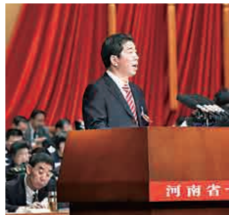
▲河南省省長陳潤兒表示，今年將加強上市後備企業培育

A股昨日突然放量巨震，滬綜指盤中急挫超2%，跌破3100點整數關口，後得金融股托市，才令跌幅收窄，收市滬綜指微幅下行0.3%，報3103.43點。創業板盤中插水超6%，創下熔断以來新低，尾盤仍重挫3.64%，日線錄得八連陰。分析人士普遍認為，近期IPO（首次公開發行股票）明顯提速，令短期資金供求惡化。市場也有消息指，中證監主席劉士余日前已召集機構座談，聽取IPO等問題市場意見。