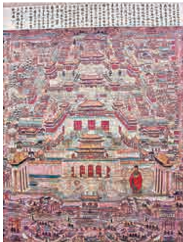
▲南京博物院藏明代宮苑圖，據考證圖中站立者為蒯祥