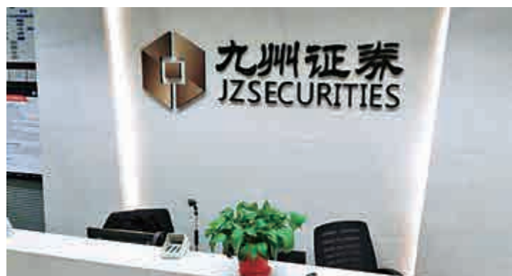
◀九州證券在北京、上海、深圳等省市擁有40多家分公司及營業部