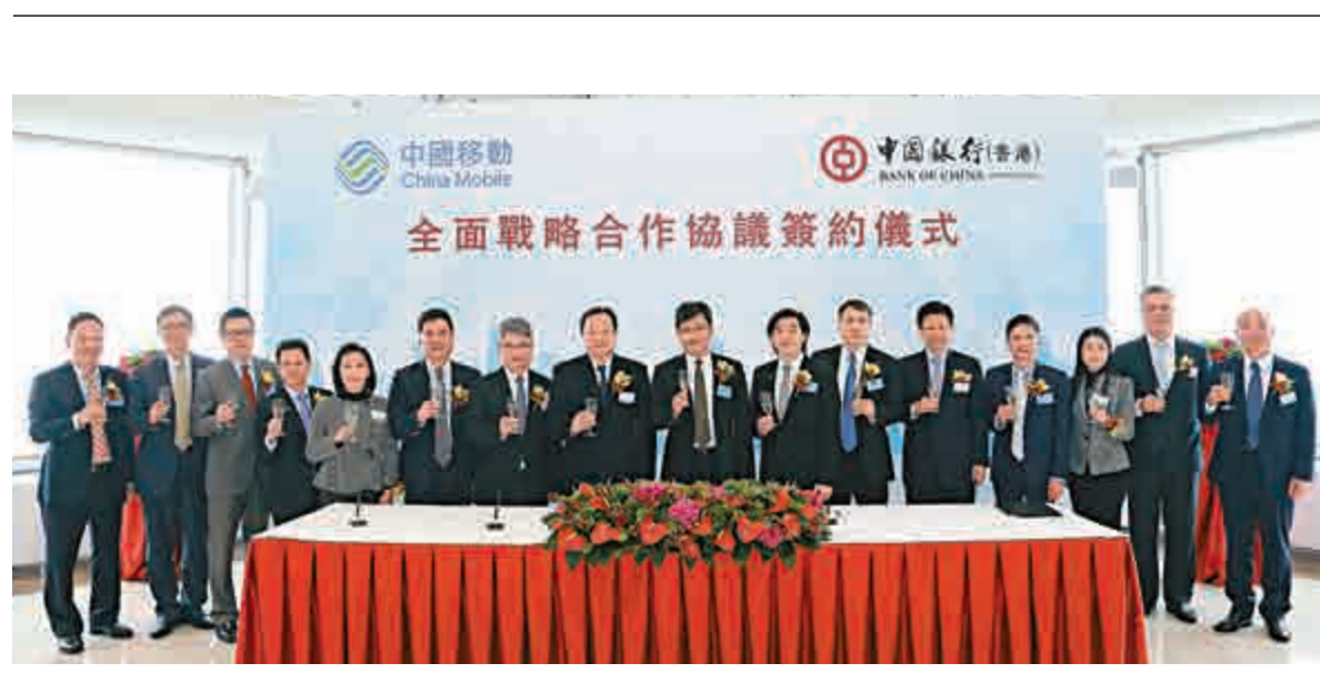
▲中銀香港副董事長兼總裁岳毅（左八）、中國移動國際及中國移動香港董事長李鋒（右八）、中銀香港副總裁林景臻（左七）及中國移動香港董事兼行政總裁李帆風（右七）等出席戰略合作協議