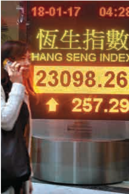
▲港股上周三試二萬三關皆鐵羽而歸，昨終升穿二萬三心理關口，收報23098點，升257點，在亞洲區內表現最強

本地地產股跑贏大市，恒生地產分類指數升1.3%，報31585點。長實地產（01113）再度入市回購，昨日股價造好，升3.3%，報52.4元。長實地產公布，昨日在市場上購入371.7萬股股份，買入價介乎50.95至52.35元，涉及金額1.94億元。長實地產連續三日回購股份，合計1158萬股，動用近6億元。恒隆地產（00101）升2.3%，報18.2元。信和置業（00083）股價升1.8%，報12.98元。