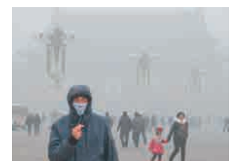
▲春節前夕，京津冀及周邊地區部分城市將出現重度污染天氣 資料圖片

環境部特別提到，邯鄲、安陽和鶴壁三市在本次污染過程中PM2.5濃度上升速度過快，且明顯高於周邊區域，顯示污染物排放量成明顯上升態勢，需要進一步強化監管，加大執法管控力度。