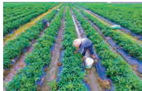
▲內地再出招保護耕地，明確耕地紅線絕不能突破

控和用途管制。從嚴控制建設佔用耕地特別是優質耕地；強化永久基本農田特殊保護，嚴禁通過擅自調整縣鄉規劃規避佔用永久基本農田的審批。據《意見》規劃，到2020年全國耕地保有量不少於18.65億畝，永久基本農田保護面積不少於15.46億畝。