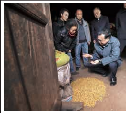
▲李克強檢視村民的作物收穫