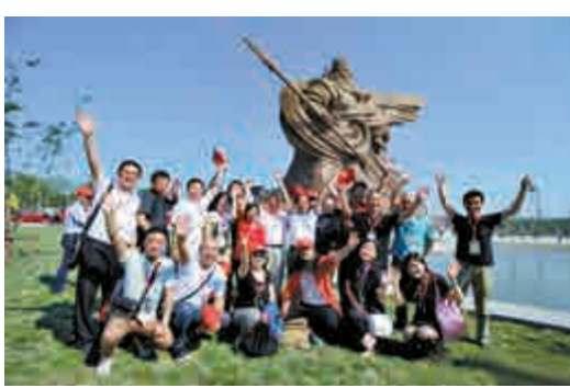
韓美林帶領工作室團隊見證《關公》雕塑揭幕落成 網絡圖片