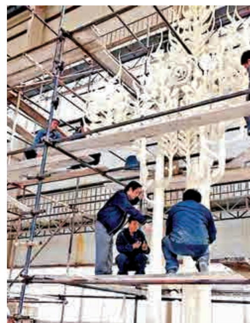
韓美林製作《和平守望》雕塑工作照 網絡圖片

相比起擰一擰和繞一繞，韓美林指，真正的藝術家應該把真表現出來，把美傳遞出去，把愛撒播給人們，讓受眾享受藝術教育。