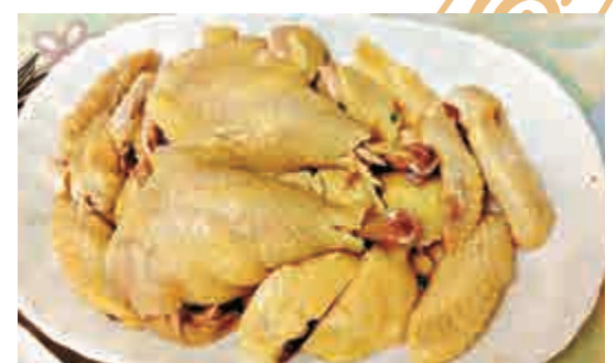
▲筆者母親所浸的白切雞

匆匆一短文，據談了有關雞的文化，當中既有文學、典故、成語等精神文明，亦有烹雞之法的物質文明，筆者無非藉此祝賀各位讀者，雞年精神暢旺，物質富足！