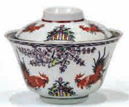
▲廣彩手繪及印花門雞帶蓋茶盅