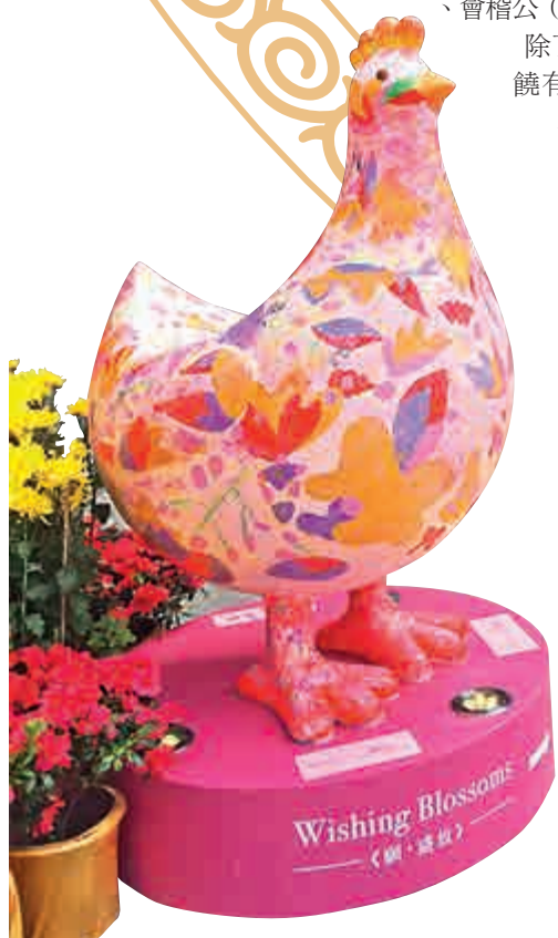
▲李冠然雞年裝飾作品「藝雕」正在山頂廣場展出至二月十四日