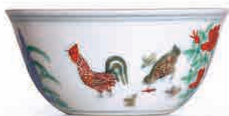
▲明成化雞缸杯在二〇一四年四月八日的香港蘇富比拍賣會上以二億八千萬港元成交