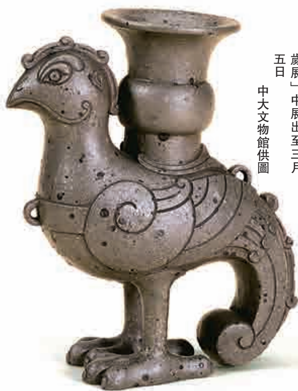
▲宜興窯《天雞壺》正在中文大學文物館「百鳥迎春：雞年賀歲展」中展出至三月五日