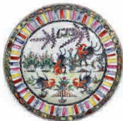
▲廣彩手繪及印花門雞盤 半愚居藏品 粵東磁廠供圖