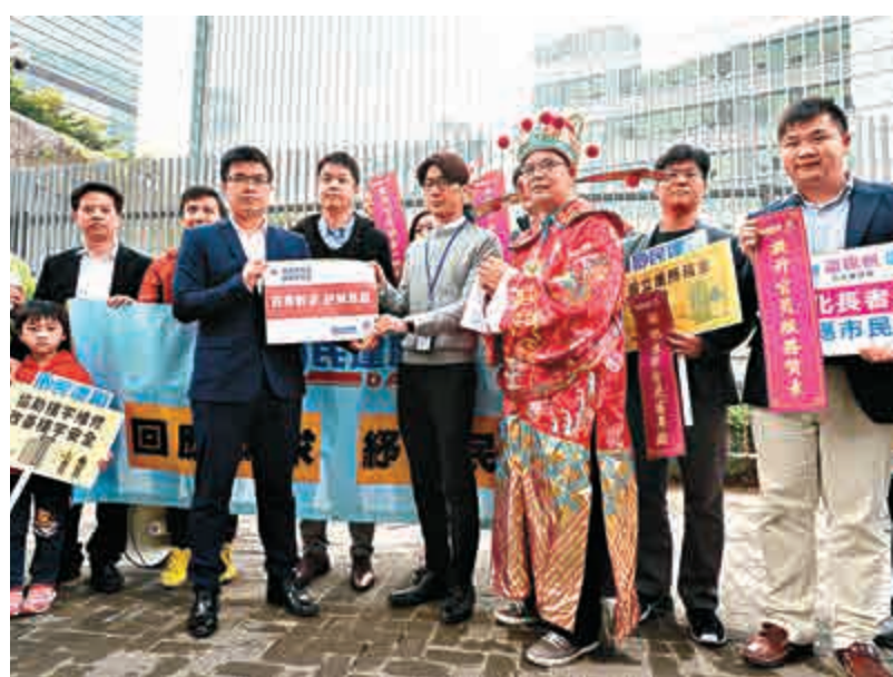
▲民建聯十多名成員請願，要求政府充分利用盈餘，紓解民困