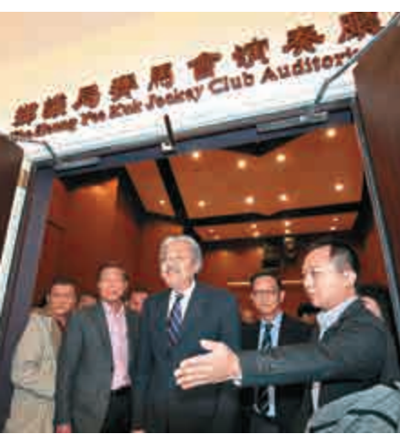
▲鄉議局昨日亦接見曾俊華（左圖）及葉劉淑儀（右圖），就雙方關心的問題交換意見

鄉議局主席劉業強稱，頗滿意葉劉淑儀的政綱，認為她有行政、立法和選舉經驗。就曾俊華的混合丁屋居屋概念，他認為是相當新的思維，但出席的選委無就此議題特別回應，他認為意見可以考慮，鄉議局持開放態度。