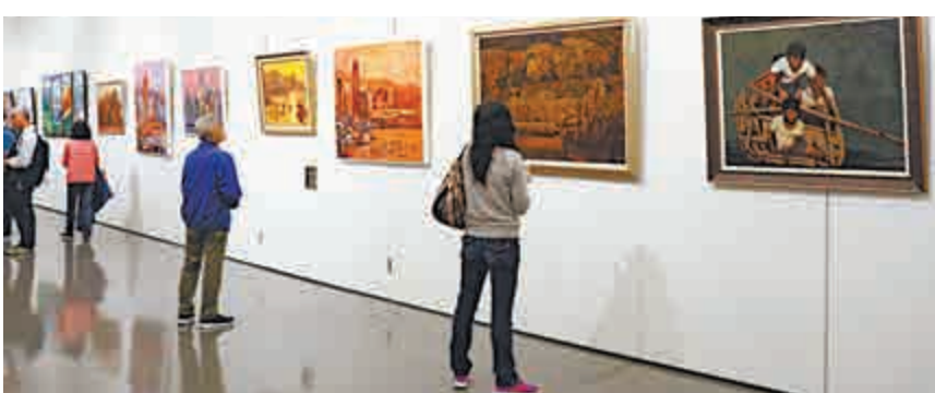
▶展場一隅，不同畫家眼中的香港風格各異

【大公報訊】記者梁舒婷報道：由香港成乾祥繪畫藝術學會策劃主辦的「畫布天地」——歐陽乃沾、徐天潤、陳朝龍、沈平、陳鏗、廖井梅、成乾祥作品展昨日開幕，匯集了七位畫家合共數十幅油畫作品，於香港中央圖書館展覽館展至二月九日。