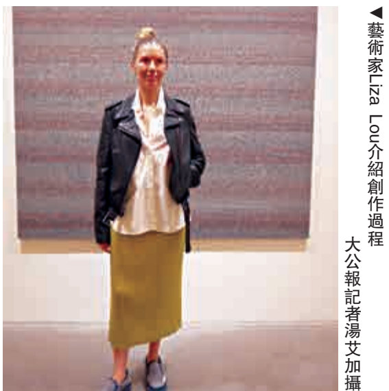
▲藝術家Liza Lou介紹創作過程

「ingxube」展期至三月十一日。立木畫廊位於香港中環畢打街12號畢打行407室，周二至六開放。查詢詳情可電二五三〇〇二五，或瀏覽網址www.lehmannmaupin.com。