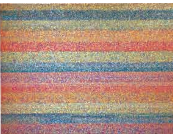
▲《ingxube》系列其中一件作品