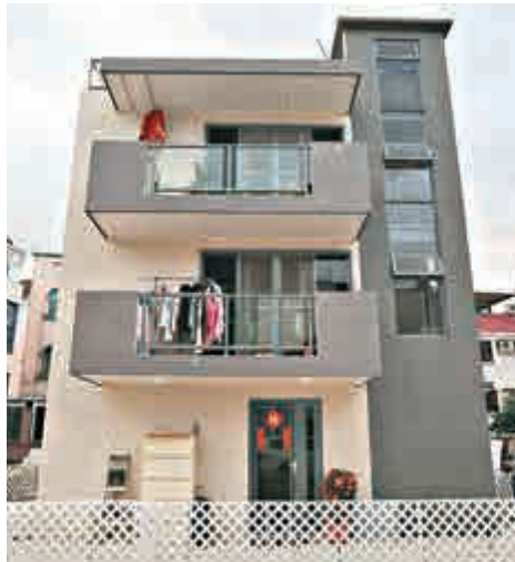
▲屯門實塘下村發生企圖毒殺子女個案