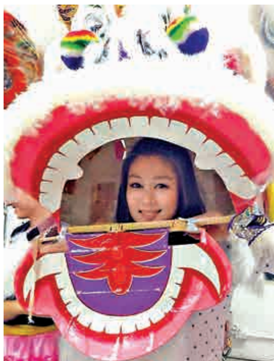
▲香港經山聰點撥，在劇中舞獅頭頭是道