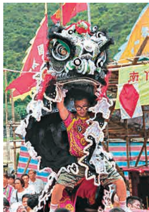
▲山聰冀為舞獅文化盡一點力