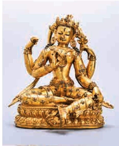
▲銅鑲金四臂度母像