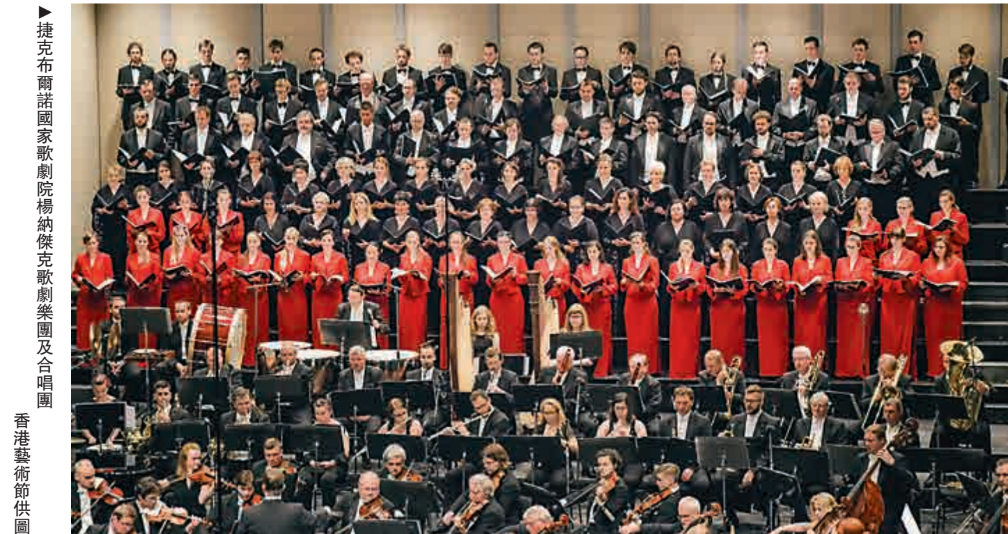
▲捷克布爾諾國家歌劇院楊納傑克歌劇樂團及合唱團

編者註：「德伏扎克《聖母悼歌》」音樂會二月二十六日下午五時舉行，「楊納傑克《小交響曲》、《永恆的福音》、《格拉高利彌撒曲》」音樂會二月二十八日晚上八時舉行，地點均為香港文化中心音樂廳。尚餘少量門票於城市售票網（www.urbix.hk）發售，節目詳情可瀏覽網址 www.hk.artsfestival.org。