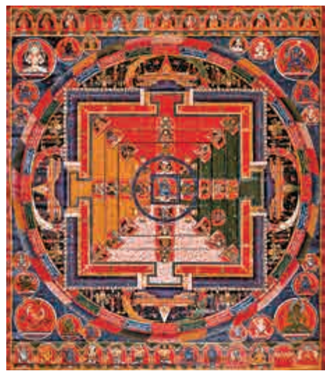
▲布畫金剛手菩薩壇城唐卡