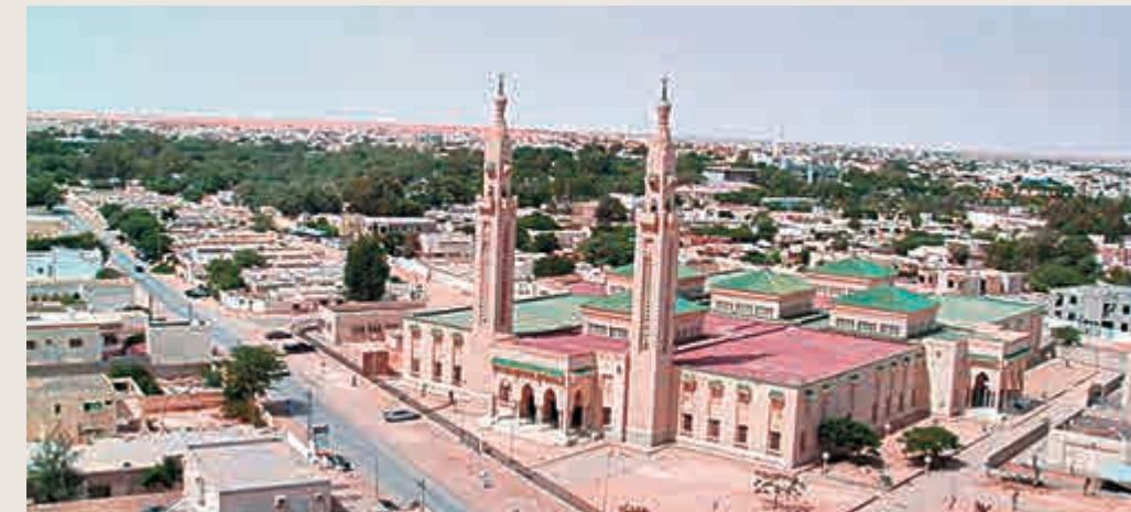
▲毛里塔尼亞首都努瓦克肖特 資料圖片

努瓦克肖特，在當地撒哈拉語裏是「風口」、「風多」的意思。這個城市位於撒哈拉沙漠的西端，三面環沙，西瀕大西洋。它常常受到風沙的侵襲。沙暴一起，天昏地暗，有時甚至漆黑如夜，要等數十分鐘甚至更長時間後才能「重見天日」。過去，這裏是一個僅有五六百居民的荒涼小村莊。在法國殖民統治時期，治理毛里塔尼亞的政治中心設在塞內加爾的聖路易港。一九六〇年十一月二十八日毛里塔尼亞宣布獨立後，政府選擇了這塊地方作為首