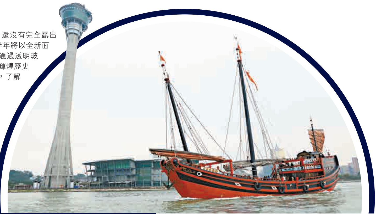
▲「南海一號」仿古船2015年春節期間曾出訪珠海。