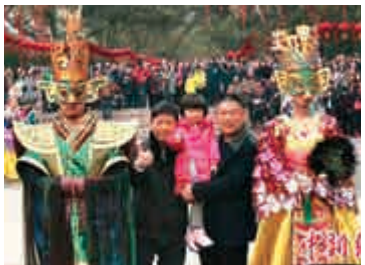
▲四川廣漢「保保節」現場。網絡圖片

意。 對於這樣極具地方風情的民俗，來自加拿大的阿拉斯代爾表示，這樣的民俗非常棒，能讓他了解到最原汁原味的四川。據了解，當天有10萬餘人參與「拉保保」活動，共拉成「保保」248對。