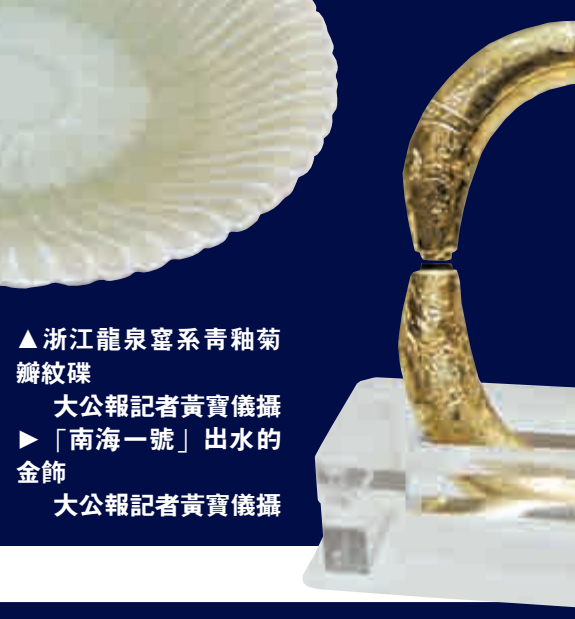
▲浙江龍泉窯系青釉菊瓣紋碗。大公報記者黃寶儀攝。▲「南海一號」出水的金飾。大公報記者黃寶儀攝