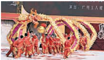
▲熱鬧歡騰的舞龍拉開大巡遊的序幕。