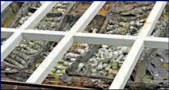
▲大批等候提取的「南海一號」文物。