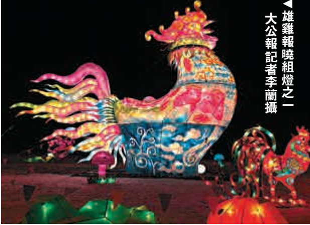
▲雄雞報曉燈組之一。

【大公報訊】記者李蘭瀋陽報道：雞年元宵佳節，在瀋陽關東影視城展出了史上最大規模《2017盛京燈會》。連日來，瀋陽市以及周邊撫順、鐵嶺、遼陽等城市的市民紛紛蜂擁而至逛花燈，場面尤為壯觀。 置身盛京燈會，似乎時光倒流，穿越回到了當年古老的皇城盛京，感受地道東北風情，回味記憶中的年味儿。今年盛京燈會綵燈數量比往年翻倍。其中最高的18米鳳舞星空燈組，最長的110米五綵燈廊，最有年味兒的元寶綵燈，最有特色的楊柳青年畫燈等，把有着古老盛京風情的關東影視城裝點得流光溢彩。 今年盛京燈會以「雄雞報春，龍鳳呈祥」為主題，一組長30米的大型「雄雞報春」燈格外亮眼，高10米雄雞羽毛藍色為底，黃、粉、紅、綠相間，顏色靚麗帶來暖暖的春意。高15米的「龍騰四海」燈組與「雄雞報春」燈組遙相呼應，形成龍鳳呈祥的美景，遊客們紛紛站在兩個大型燈組中間拍照留念。